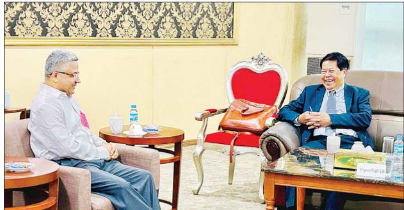
သတင်းစဉ်

ရန်ကုန် ဇူလိုင် ၁၀ ဒုတိယဝန်ကြီးချုပ်နှင့် နိုင်ငံခြားရေးဝန်ကြီးဌာန ပြည်ထောင်စုဝန်ကြီး ဦးသန်းဆွေ ခေါင်းဆောင်သည့် မြန်မာကိုယ်စားလှယ်အဖွဲ့သည် အိန္ဒိယသမ္မတနိုင်ငံ ပြည်ပရေးရာဝန်ကြီး ဒေါက်တာ အက်စ်ဂျိုင်ရှန်ကာ ၏ ဖိတ်ကြားချက်အရ နယူးဒေလီမြို့၌ ကျင်းပမည့် ဒုတိယအကြိမ် ဘင်းမ်စတင် နိုင်ငံခြားရေးဝန်ကြီး များ၏ သီးသန့်အစည်းအဝေးသို့ တက်ရောက်ရန် ယနေ့တွင် ရန်ကုန်မြို့မှ လေကြောင်းခရီးဖြင့် အိန္ဒိယ နိုင်ငံသို့ ထွက်ခွာသွားရာ မြန်မာနိုင်ငံဆိုင်ရာ အိန္ဒိယ သံအမတ်ကြီး မစ္စတာ အဘိဟောတာကူရန်နှင့် နိုင်ငံခြားရေးဝန်ကြီးဌာနမှ တာဝန်ရှိသူများက ရန်ကုန်အပြည်ပြည်ဆိုင်ရာလေဆိပ်၌ ပို့ဆောင် နှုတ်ဆက်ခဲ့ကြသည်။