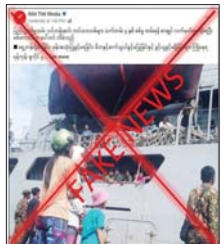
ဆိုင်ရာ အသိပညာပေး သတင်းများ၊ ထုတ်လွှင့်ချက်များနှင့် https://mod.gov.mm/node/74 တို့တွင် စဉ်ဆက်မပြတ် ထုတ်လွှင့်အသိပေးလျက်ရှိပြီး သိရှိလိုသည်များ မရှင်းလင်းသည့် အကြောင်းအရာများနှင့်ပတ်သက်၍ ပြည်သူ့စစ်မှုထမ်းဗဟိုအဖွဲ့၊ တိုင်းဒေသကြီးအဆင့်၊ ပြည်နယ်များအဆင့် ပြည်သူ့စစ်မှုထမ်း ဆိုင်ခေါ်ရေးအဖွဲ့များ၏ ဆက်သွယ်ရန် ဖုန်းနံပါတ်များသို့ ရုံးချိန်များအတွင်း ဆက်သွယ်ပေးခြင်းနိုင်ပါကြောင်း သတင်းရရှိသည်။ သတင်းစဉ်

သို့ရာတွင် တရားမဝင်ပြည်ဖျက်မီဒီယာများနှင့် အကြမ်းဖက် အဖွဲ့အစည်းများသည် လူငယ်၊ လူရွယ်များ လမ်းဖျားရောက်စေရန်အတွက် အချိန်ကိုက်သွေးထိုးလှုံ့ဆော်ဝါဒဖြန့်ဝေထုတ်လွှင့်လျက်ရှိပြီး လုပ်ကြံဖန်တီးထားသည့်သတင်းများ၊ ကောလဟာလသတင်းများကို အချိန်ကိုက် ဝါဒဖြန့်ချိလျက်ရှိရာ အခြေအမြစ်မရှိသည့် သတင်းအမှားများကြောင့် စိုးရိမ်ပူပန်မှု၊ အသိအမြင်လွှဲမှားမှုများ မဖြစ်ပေါ်စေရန် မိဘပြည်သူများအနေဖြင့် စစ်မှုထမ်းဆိုင်ရာသတင်းများသိရှိနိုင်စေရေး နိုင်ငံပိုင်မီဒီယာများ၊ စစ်မှုထမ်း