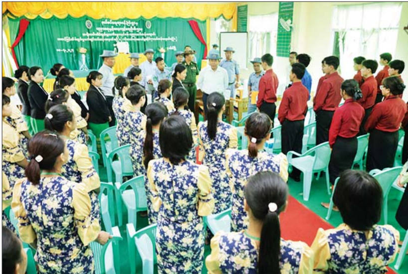
ပြည်ထောင်စုဝန်ကြီး ဒုတိယဗိုလ်ချုပ်ကြီး ထွန်းထွန်းနောင် အမျိုးသမီးအိမ်တွင်းမှ သက်မွေးလုပ်ငန်းပညာ သင်တန်းကျောင်း (ပုသိမ်)ရှိ အိမ်တွင်းမှနှင့် ဟိုတယ်ဝန်ဆောင်မှုသင်တန်းများမှ သင်တန်းသား သင်တန်းသူများအား ရင်းရင်းနှီးနှီး နှုတ်ဆက်စဉ်။

နေပြည်တော် ဇူလိုင် ၁၀ နယ်စပ်ရေးရာဝန်ကြီးဌာန ပြည်ထောင်စုဝန်ကြီး ဒုတိယဗိုလ်ချုပ်ကြီး ထွန်းထွန်းနောင်သည် ဧရာဝတီတိုင်းဒေသကြီးအစိုးရအဖွဲ့၊ လုံခြုံရေးနှင့် နယ်စပ်ရေးရာဝန်ကြီး ဗိုလ်မှူးကြီး မိုးမင်းနိုင်၊ နယ်စပ်ရေးရာဝန်ကြီးဌာန အမြဲတမ်းအတွင်းဝန်၊ တာဝန်ရှိသူများနှင့် အတူ ဇူလိုင် ၈ ရက်က မအူပင်မြို့နှင့် ဘိုကလေးမြို့တို့ရှိ နယ်စပ်ဒေသတိုင်းရင်းသား လူငယ်များဖွံ့ဖြိုးရေးသင်တန်းကျောင်းများသို့ သွားရောက်ကြည့်ရှု စစ်ဆေးပြီး သက်ဆိုင်ရာကျောင်းများမှ ကျောင်းအုပ်များ၏ သင်တန်းကျောင်းဆိုင်ရာ အချက်အလက်များ ရှင်းလင်း တင်ပြမှုအပေါ် ပြည်ထောင်စုဝန်ကြီးက လိုအပ်သည်များ မှာကြားဖြည့်ဆည်း ဆောင်ရွက်ပေးသည်။