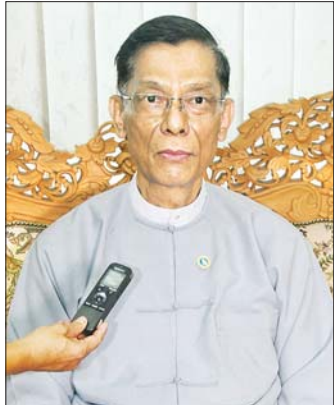
မြန်မာနိုင်ငံတော်ဗဟိုဘဏ် ဒုတိယဥက္ကဋ္ဌ ဒေါက်တာလင်းအောင်

မေး။ ။ လူမှု့ကွန်ရက်စာမျက်နှာတွေမှာ ပုဂ္ဂလိကဘဏ်တွေမှာ ငွေထုတ်ယူမှုများပြားလာတယ်၊ ငွေသားထုတ်ယူမှုကိုလည်း ကန့်သတ်နေတယ်၊ ပုဂ္ဂလိကဘဏ်တွေက အကန့်အသတ်နဲ့သာ ငွေထုတ်ပေးနေတယ် စသဖြင့်ရေးသားဖော်ပြ ပြောဆိုနေတာကို တွေ့ရပါတယ်။ ဒါနဲ့ပတ်သက်ပြီး ဗဟိုဘဏ်အနေနဲ့ ရှင်းလင်းပြောကြားပေးစေလိုပါတယ်။