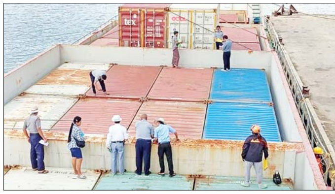
ကုန်သွယ်ရေးပုံစံအသစ် စနစ်အသစ်ဖြင့် ရန်ကုန် - ကော့သောင်း - ရနောင်းသို့ စတင်ပြေးဆွဲသည့် ကုန်တင်သင်္ဘောကို တွေ့ရစဉ်။

ရန်ကုန်မြို့မှ ထိုင်းနိုင်ငံ ရနောင်း မြို့သို့ နယ်စပ်ကုန်သွယ်ရေး (Border Trade Method) စနစ် ဖြင့် ရောက်ရှိလာသည့် အဆိုပါ ကုန်တင်သင်္ဘောမှာ ကော့သောင်း မြို့ဆိပ်ကမ်းတွင် Check Point အစစ်ဆေးခံခဲ့ရခြင်း ဖြစ်ကြောင်း သိရသည်။