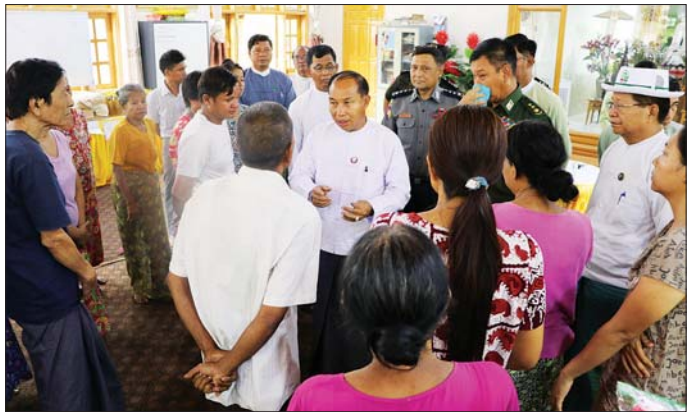
မရှိစေရေးအတွက် ဌာနဆိုင်ရာများနှင့် ရပ်ကွက်နေ ပြည်သူများက ချင်းတွင်းမြစ်ရိုးတစ်လျှောက် ရေထိန်းတာပေါင်များအား အဆင့်မြှင့်တင် ဆောင်ရွက်နေမှုများနှင့် ရေစိမ့်ဝင်သည့်နေရာများကို သဲအိတ်များဖြင့် ကာရံနေမှုများကို လိုက်လံကြည့်ရှု

ထို့နောက် တိုင်းဒေသကြီး ဝန်ကြီးချုပ်နှင့် တာဝန်ရှိသူများသည် မုံရွာမြို့အား ချင်းတွင်းမြစ်ရေ ရောက်ရှိမှုအခြေအနေနှင့် မြစ်ရေဝင်ရောက်မှု