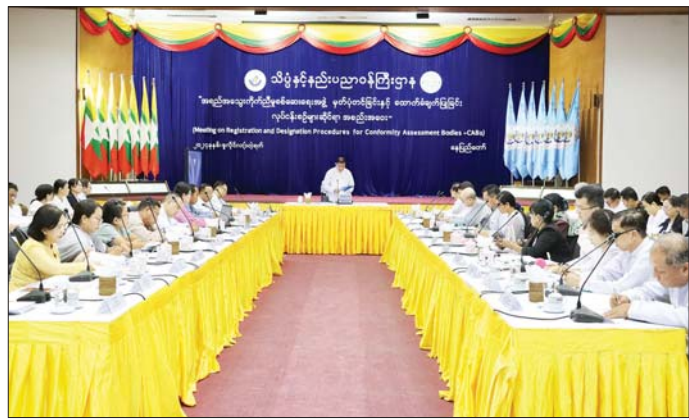
ထောက်ခံချက်ပြုခြင်း (Designation) လုပ်ငန်းစဉ်များနှင့် မှတ်ပုံတင်ခြင်းဆိုင်ရာ အမိန့်၊ ကြော်ငြာစာ (မူကြမ်း)တို့ကို ချမှတ် ဆောင်ရွက်အကောင်အထည်ဖော် ဆောင်ရွက်နိုင်ရန် ဆွေးနွေးကြ မည်ဖြစ်ကြောင်းနှင့် အရည် အသွေးကိုကိညီမှု စစ်ဆေးရေး အဖွဲ့များအား နိုင်ငံတကာနှင့် ဒေသတွင်းနိုင်ငံများဖြင့် အပြန် အလှန် အသိအမှတ်ပြုခြင်းများ (Mutual Recognized Arrangement) ရရှိရန် ဆက်လက် ဆောင်ရွက်သွားမည်ဖြစ်ကြောင်း သိရှိရသည်။ သတင်းစဉ်

ရေး နည်းပညာဆက်ကော်မတီ အဖွဲ့ဝင်များ၊ ဝန်ကြီးဌာနများမှ ကိုယ်စားလှယ်များ၊ အရည် အသွေးထောက်ခံချက်ထုတ်ပေး သော အစိုးရ-ပုဂ္ဂလိကအဖွဲ့ အစည်းများ၊ မြန်မာအစား အသောက် ဓာတ်ခွဲခန်းများ ကွန်ရက်အဖွဲ့ဝင် ဓာတ်ခွဲခန်း ကိုယ်စားလှယ်များ၊ အစိုးရနှင့် ပုဂ္ဂလိကကဏ္ဍများရှိ အရည် အသွေး ထောက်ခံချက်ပေးရေး အဖွဲ့အစည်းများကိုယ်စားလှယ် များ တက်ရောက်ကြသည်။ အစည်းအဝေးတွင် သိပ္ပံနှင့် နည်းပညာဝန်ကြီးဌာန ပြည်ထောင်စုဝန်ကြီး ဒေါက်တာ မျိုးသိန်းကျော်၊ ဆက်စပ်ဝန်ကြီး ဌာနများမှ ဒုတိယဝန်ကြီးများ၊ အမျိုးသားစံချိန်စံညွှန်းကောင်စီ ကိုကိညီမှု စစ်ဆေးရေးအဖွဲ့များ မှတ်ပုံတင်ခြင်း (Registration)၊