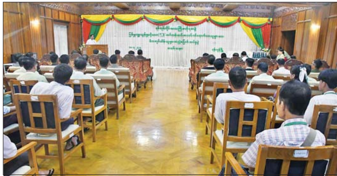
ဖြင့် ယခုလို ကြိုဆိုလိုက်သော အခြေနေတွေကို နီးစပ်ရာ သက်ဆိုင်သူများကိုပါ ပြောပြပြီး ထပ်မံစဉ်းစားပေးကြရန် လိုပါကြောင်း၊ အလင်းဝင်ရောက်လာသူများအနေဖြင့် ပြန်လည်ဝင်ရောက်လာကာ နောက်ပိုင်းကာလမှာ ကောင်းမွန်စွာနေထိုင်ပြီး နိုင်ငံအကျိုးပြုသူများဖြစ်လာစေရန် ကြိုးစားနေထိုင်

ရန်ကုန် ဇူလိုင် ၁၀ ပြစ်မှုကျူးလွန်မှုမရှိသော PDF သင်တန်းဆင်း အလင်းဝင်ရောက်လာသူများအား မိဘအုပ်ထိန်းသူများထံ လွှဲပြောင်းအပ်နှံခြင်း အခမ်းအနားကို ယနေ့ နံနက်ပိုင်းက ရန်ကုန်တိုင်းဒေသကြီး အစိုးရအဖွဲ့ရုံး မင်္ဂလာဒန်းမဉ်းကျင်းပသည်။ (ယာဝု)