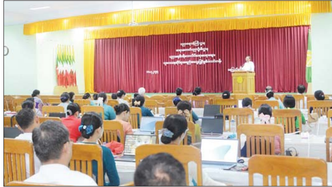
တာဝန်ရှိသူများ၊ ဆရာအတတ် ပညာဦးစီးဌာနနှင့် ပညာရေးဒီဂရီ ကောလိပ်များမှ ဆရာ ဆရာမများ နှင့် သင်တန်းသား သင်တန်း သူများ တက်ရောက်ကြသည်။ အခမ်းအနားတွင် ဒုတိယ ဝန်ကြီး ဒေါက်တာဇော်မြင့်က ဆရာအတတ်ပညာဦးစီးဌာန အနေဖြင့်ပညာရေးဒီဂရီကောလိပ်

နေပြည်တော် ဇူလိုင် ၁၀ ပညာရေးဝန်ကြီးဌာန ဆရာ အတတ်ပညာဦးစီးဌာန၊ ပညာရေး ဒီဂရီကောလိပ်ဆရာ ဆရာမများ၊ သုတေသနဆိုင်ရာ အရည်အသွေး မြှင့်သင်တန်းဖွင့်ပွဲ အခမ်းအနားကို ယနေ့နံနက် ၉ နာရီခွဲတွင် နေပြည် တော်ရှိ ပညာရေးဝန်ကြီးဌာန၌ ကျင်းပသည်။ အခမ်းအနားသို့ ပညာရေး ဝန်ကြီးဌာန ဒုတိယဝန်ကြီး ဒေါက်တာဇော်မြင့်နှင့် ဒေါက်တာ မိုးဇော်ထွန်း၊ အမြဲတမ်းအတွင်းဝန် ပညာရေးဝန်ကြီးဌာနရှိ ဦးစီးဌာန များမှ ညွှန်ကြားရေးမှူးချုပ်များ၊ ဒုတိယအမြဲတမ်းအတွင်းဝန်များ၊ ဒုတိယညွှန်ကြားရေးမှူးချုပ်များ၊