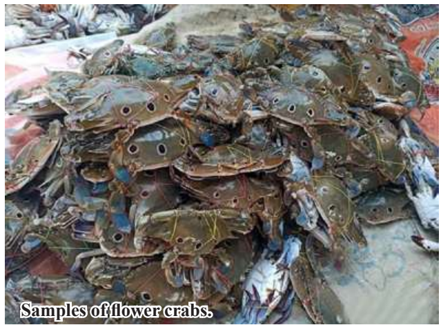
Samples of flower crabs.

neurs sell marine products including flower crabs to Yangon market, fetching K285,000 per 10 viss of flower crabs. Kyaw Kyaw Lin