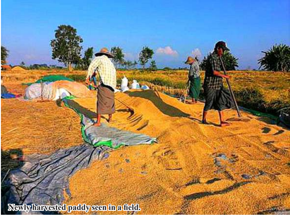
Newly harvested paddy seen in a field.