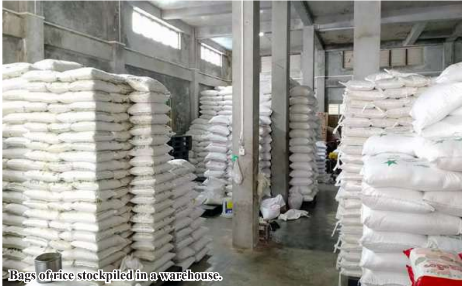
Bags of rice stockpiled in a warehouse.

Mawlamyinegyun January 23 Region, was shipped and township. A total of 70,000 bags sold to the Yangon market in December, said Daw Kyaw Nway Nway, the owner of a rice trading fair from the township. Only 50,000 bags of Thai rice varieties Bay Kyaw from Mawlamyinegyun Township were sold to the