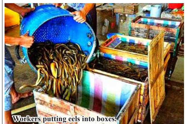
Workers putting eels into boxes.