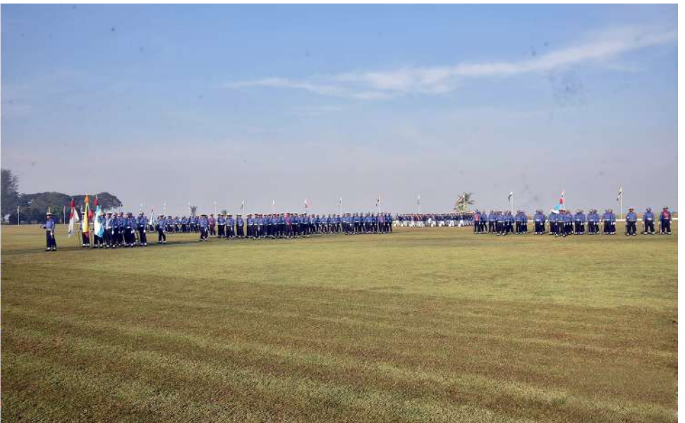
နိုင်ငံတော်စီမံအုပ်ချုပ်ရေးကောင်စီဥက္ကဋ္ဌ တပ်မတော်ကာကွယ်ရေးဦးစီးချုပ် ကိုယ်စား ကာကွယ်ရေးဦးစီးချုပ်(ရေ) ဗိုလ်ချုပ်ကြီးထိန်ဝင်း တပ်မတော်(ရေ) အရာရှိငယ်(စီမံခန့်ခွဲရေး)သင်တန်းအမှတ်စဉ်(၈၄)နှင့် တပ်မတော်(ရေ)အရာရှိငယ်(အင်ဂျင်နီယာ)သင်တန်း အမှတ်စဉ်(၅၈)သင်တန်းဆင်းပွဲနှင့်ဂုဏ်ပြုစာစားပွဲအခမ်းအနားတွင် မိန့်ခွန်းပြောကြားစဉ်။

နေပြည်တော် ဇန်နဝါရီ ၂၃ ဆင်းဂုဏ်ပြုစာစားပွဲအခမ်းအနားကို ယနေ့နံနက် ဦးစီးချုပ် ကိုယ်စား ကာကွယ်ရေးဦးစီးချုပ်(ရေ) (ကြည်း)မှ တပ်မတော်လေ့ကျင့်ရေးအရာရှိချုပ် တပ်မတော်(ရေ) အရာရှိငယ် (စီမံခန့်ခွဲရေး) ပိုင်းတွင် သန်လျင်တပ်နယ်ရှိ ရေတပ်လေ့ကျင့်ရေး ဗိုလ်ချုပ်ကြီးထိန်ဝင်း တက်ရောက်မိန့်ခွန်းပြော (ကြည်း)မှ တပ်မတော်လေ့ကျင့်ရေးအရာရှိချုပ် သင်တန်းအမှတ်စဉ်(၈၄)နှင့် တပ်မတော်(ရေ)အရာရှိ ဌာနချုပ် စစ်ရေးပြကွင်း၌ ကျင်းပရာ နိုင်ငံတော်စီမံ ဖိုလ်ချုပ်ကြီးထိန်ဝင်း တက်ရောက်မိန့်ခွန်းပြော (ကြည်း)မှ တပ်မတော်လေ့ကျင့်ရေးအရာရှိချုပ် ငယ်(အင်ဂျင်နီယာ)သင်တန်း အမှတ်စဉ်(၅၈)သင်တန်း အုပ်ချုပ်ရေးကောင်စီဥက္ကဋ္ဌ တပ်မတော်ကာကွယ်ရေး အဆိုပါအခမ်းအနားသို့ ကာကွယ်ရေးဦးစီးချုပ်ရုံး ဒုတိယဗိုလ်ချုပ်ကြီးထိန်ဝင်း၊ စစ်ဦးစီးအရာရှိချုပ်(ရေ) ဒုတိယဗိုလ်ချုပ်ကြီးအေးမင်းထွေး၊ စာမျက်နှာ ၁၇ ကော်လံ ၁ ☆