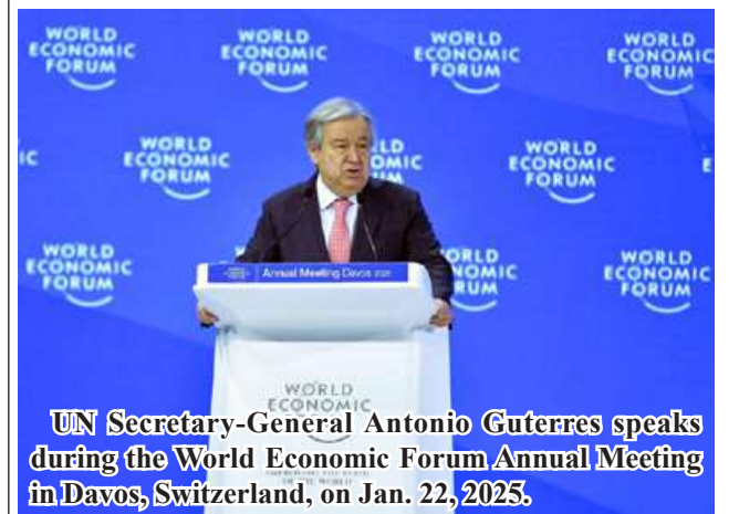
UN Secretary-General Antonio Guterres speaks during the World Economic Forum Annual Meeting in Davos, Switzerland, on Jan. 22, 2025.

Davos January 23 The United Nations (UN) chief on Wednesday issued a stark warning about the mounting challenges facing humanity, including the climate crisis and geopolitical divisions, and urged the global community to work together to tackle them. Addressing the World Economic Forum Annual Meeting in Davos, Switzerland, UN Secretary-General Antonio Guterres said the world was confronting a "Pandora's box of troubles" and emphasized that collaboration is the key to addressing these challenges. He painted a dire picture of the climate emergency, likening humanity's dependence on fossil fuels to a "Frankenstein monster" that spares no one. "Our fossil fuel addiction is a Frankenstein monster, sparing nothing and no one. All around us, we see clear signs that the monster has become the master," he said. "Sea-level rise, heatwaves, floods, storms, droughts, and wildfires are just a preview of the horror movie to come." The UN chief urged governments to honor their promises by delivering new climate action plans ahead of the COP30 climate change conference in Brazil. He also called on financial institutions to support the energy transition in developing nations. Xinhua