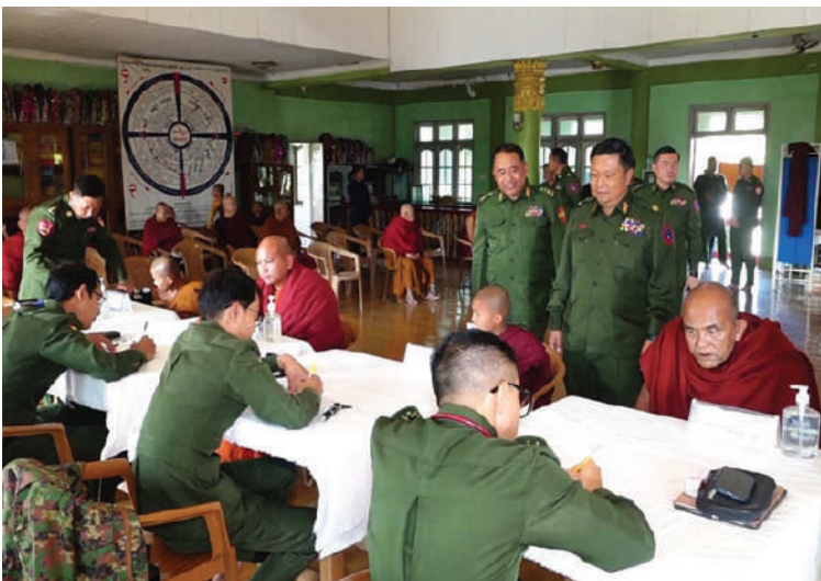
သံဃာတော်များအား မြောက်ပိုင်းတိုင်းစစ်ဌာနချုပ် နယ်လှည့်ဆေးကုသရေး အဖွဲ့က ကျန်းမာရေးစောင့်ရှောက်မှုလုပ်ငန်းများဆောင်ရွက်ပေးစဉ်။

နေပြည်တော် ဇန်နဝါရီ ၂၃ - ကချင်ပြည်နယ် မြစ်ကြီးနားမြို့ရှိ ပဋိပတ္တိမာမကကျောင်းတိုက်မှ သံဃာတော်များအား ယနေ့နံနက်ပိုင်းတွင် မြောက်ပိုင်းတိုင်းစစ်ဌာနချုပ် နယ်လှည့်ဆေးကုသရေးအဖွဲ့က အဆိုပါကျောင်းတိုက်၌ ကျန်းမာရေးစောင့်ရှောက်မှု လုပ်ငန်းများ ဆောင်ရွက်ပေးသည်။ ထိုသို့ ဆောင်ရွက်ပေးရာတွင် ဆေးကုသရေးအဖွဲ့က သံဃာတော် ၃၇ ပါးတို့ကို ခွဲစိတ်ကုသမှုဆိုင်ရာရောဂါ၊ အရိုးအကြောရောဂါ၊ အာရုံကြောအားနည်းခြင်းရောဂါ၊ အထွေထွေရောဂါတို့နှင့်ပတ်သက်၍ လိုအပ်သည့်ကျန်းမာရေးစစ်ဆေးကုသပေးခြင်း၊ ECG စက်ဖြင့် နှလုံးစမ်းသပ်