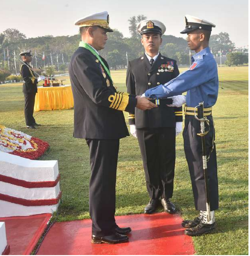
ကာကွယ်ရေးဦးစီးချုပ်(ရေ) ဗိုလ်ချုပ်ကြီးထိန်ဝင်း တပ်မတော်(ရေ)အရာရှိငယ် (စီမံခန့်ခွဲရေး)သင်တန်းအမှတ်စဉ်(၈၄)မှ ရေကြောင်းပညာစာပေထူးချွန်ဆုရ ရေ ၅၇၄၅ ဗိုလ်ဟိန်းထက်အောင်အား ထူးချွန်ဆုပေးအပ်ချီးမြှင့်စဉ်။