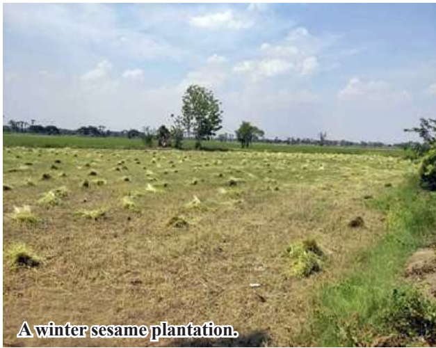
A winter sesame plantation.