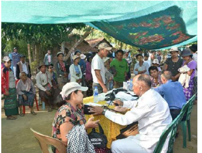
တပ်မတော်မြစ်တွင်းသွားဆေးရုံရေယာဉ်(ရွှေပုဇွန်)နှင့် မြစ်ရေယာဉ်(စကု)တို့မှ နယ်လှည့်အထူးကုဆေးအဖွဲ့က ကျိုက်လတ်မြို့နယ် ပတုတ်ကျေးရွာရှိ ဒေသခံပြည်သူများကို ကျန်းမာရေးစောင့်ရှောက်မှုလုပ်ငန်းများဆောင်ရွက်ပေးစဉ်။

နေပြည်တော် ဇန်နဝါရီ ၂၃ ရောဂါတစ်ကြောင်း တစ်လျှောက်ရှိ ဒေသခံပြည်သူများကို ကျန်းမာရေးစောင့်ရှောက်မှုလုပ်ငန်းများ ဆောင်ရွက်ပေးရန်အတွက် တပ်မတော်မြစ်တွင်းသွားဆေးရုံရေယာဉ်(ရွှေပုဇွန်)၊ မြစ်ရေယာဉ်(စကု)တို့နှင့်အတူလိုက်ပါလာသည့် တပ်မတော်မှ ပါရဂူများဆေးမှူးများ၊ သူနာပြုများပါဝင်သော နယ်လှည့်အထူးကုဆေးအဖွဲ့သည် ယနေ့တွင် ရောဂါတိုင်းဒေသကြီးကျိုက်လတ်မြို့နယ် ပတုတ်ကျေးရွာအခြေခံပညာအလယ်တန်းကျောင်း(ခွဲ)တွင် အခြေပြု၍ အဆိုပါကျေးရွာနှင့် ပတ်ဝန်းကျင်ကျေးရွာများမှ ဒေသခံပြည်သူဦးရေ ၄၅၀ တို့ကို ကျန်းမာရေးစောင့်ရှောက်မှုလုပ်ငန်းများ ဆောင်ရွက်ပေးသည်။