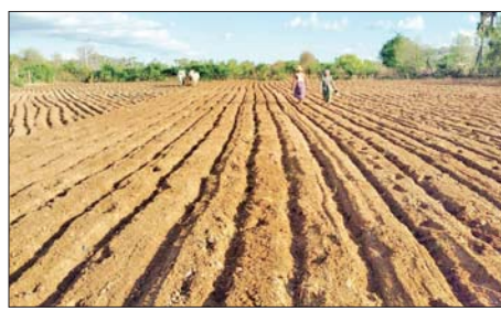
ဆီထွက်နှမ်းကို မိုးနှမ်းနှင့် အဖြစ် ပဲစင်းငုံနှင့် ကွေစုဖရုံများ ဆောင်းနှမ်း နှစ်ကြိမ်ကြပ်ပတ် စိုက်ပျိုးကြကြောင်း သိရသည်။ ဒီပါလင်း

ညောင်ဦး မေ ၁၃ မန္တလေး တိုင်းဒေသကြီး ညောင်ဦးမြို့နယ်၌ မိုးစတင်ရွာသွန်း ပြီးဖြစ်သဖြင့် တောင်သူများ ဆီထွက်သီးနှံ မြေပဲနှင့်နှမ်းများကို စတင်စိုက်ပျိုးလျက်ရှိသည်။ ညောင်ဦးမြို့နယ်၌ မေ ၁၀ ရက်နှင့် ၁၁ ရက်တို့တွင် တောင်သူများ ထွန်းယက်စိုက်ပျိုးနိုင်သည့်အထိ မိုးရွာသွန်းခဲ့သဖြင့် ဆီထွက်သီးနှံ မျိုးကောင်းမျိုးသန့်များ စတင် စိုက်ပျိုးလျက်ရှိကြသည်။ အဓိကထားစိုက်ပျိုး ညောင်ဦးမြို့နယ်၌ ယာမြေ အများစုဖြစ်သည့်အတွက် မိုးရာသီ၌သာ ဆီထွက်သီးနှံများ အဓိက ထားစိုက်ပျိုးကြပြီး မြေပဲကို ပင်ထောင်မြေပဲ (သုံးလ) ပဲနှင့် ပင်ပြန်မြေပဲ (ခြောက်လ)ပဲ၊ နှစ်ကြိမ် စိုက်ပျိုးကြကြောင်း၊