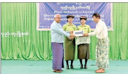
တာဝန်ရှိသူများက တောင်သူ ၅၅ ဦးထံသို့ စိုက်ပျိုးစရိတ်ချေးငွေများ ပေးအပ်ခဲ့ကြောင်း သိရသည်။