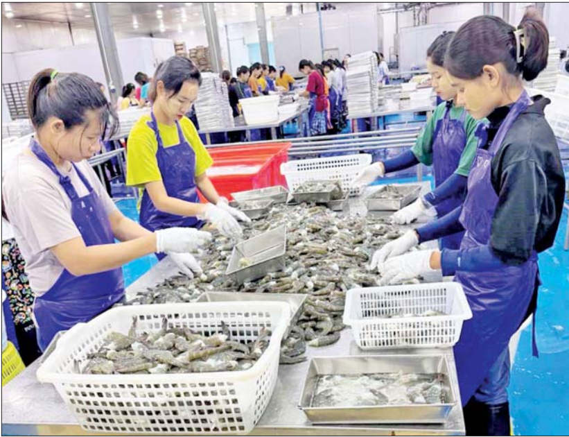
မြိတ်ကျွန်းစုမှ ဂျပန်နိုင်ငံသို့တင်ပို့မည့် ပနားဗီးပုစွန်ဖြူအေးခဲရန် ပြင်ဆင်နေစဉ်။