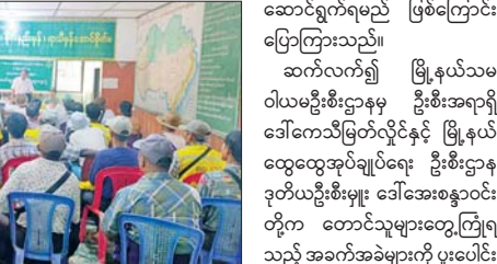
အတွက် သဘာဝမြေဩဇာနှင့် ဓာတ်မြေဩဇာသွင်းအားစုများကို အလွယ်တကူဝယ်ယူသုံးစွဲနိုင်ရန် ဆောင်ရွက်သွားမည်ဖြစ်ကြောင်း၊ မိုးစပါးနှင့် ဆောင်းသီးနှံများကို နိုင်ငံစီးပွား မြှင့်တင်ရေးရန်ပံ့ပိုး