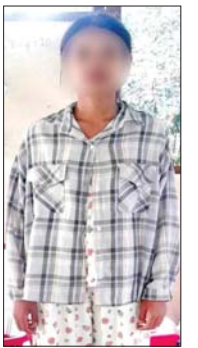
Drone ကျရောက်ပေါက်ကွဲမှုကြောင့် ထိခိုက်ဒဏ်ရာရရှိခဲ့သည့် မူလတန်း ကျောင်းအုပ်ဆရာနှင့် ရုံးဝန်ထမ်းများအား တွေ့ရစဉ်။

ထိုသို့ လုပ်ဆောင်လျက်ရှိရာ မေ ၁၂ ရက်တွင် စစ်ကိုင်းတိုင်း ဒေသကြီး အင်းတော်မြို့ရှိ အခြေခံ ပညာအထက်တန်းကျောင်း (ခွဲ) (အောင်ဇေယျ) ၌ ဆရာ ဆရာမ များနှင့် ရုံးအဖွဲ့များက ကျောင်းဖွင့် ရာသီတွင်ကျောင်းသားကျောင်းသူ များ ကျောင်းအုပ်နှစ်ဦး၊ စာသင် ခန်းများနှင့် သင်ထောက်ကူ ပစ္စည်းများ စနစ်တကျရှိစေရေး စသည့် ကြိုတင်ပြင်ဆင်မှု လုပ်ငန်း များ ဆောင်ရွက်နေစဉ် နံနက် ၁၁