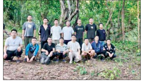
တရားမဝင်တရုတ်နိုင်ငံသား အမျိုးသား ၁၅ ဦးကို တွေ့ရစဉ်။