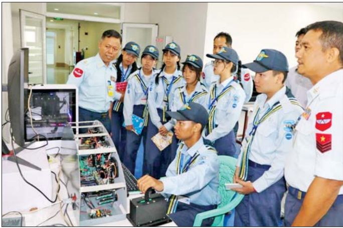
လေကြောင်းလူငယ် အခြေခံသင်တန်းများနှင့် တန်းမြင့်သင်တန်းများမှ သင်တန်းသား သင်တန်းသူ များ ပျံသန်းရေးအုပ်များသို့ လက်တွေ့ကွင်းဆင်းလေ့လာစဉ်။

ကျောင်းသား ကျောင်းသူ မျိုးဆက်သစ်လူငယ် မောင်မယ်များကို နွေရာသီကျောင်းပိတ်ရက်ကာလ အတွင်း အသိပညာများ ဖွံ့ဖြိုးတိုးတက်စေရန်၊ အားလပ်ရက်များ အကျိုးရှိစေရန်၊ မိမိဝါသနာပါသည့် ပညာရပ်များကို လေ့လာဆည်းပူးနိုင်စေရန်နှင့် နိုင်ငံတော်အတွက် ရေကြောင်းပညာ၊ လေကြောင်း ပညာကျွမ်းကျင်သော အနာဂတ်မျိုးဆက်သစ်လူငယ် များ ပေါ်ထွန်းလာစေရန်ရည်ရွယ်၍ တပ်မတော်(ရေ) က ရေကြောင်းလူငယ်အခြေခံနှင့် တန်းမြင့်သင်တန်း များ၊ တပ်မတော်(လေ)က အခြေခံလေကြောင်း လူငယ်သင်တန်းနှင့် တန်းမြင့်လေကြောင်းလူငယ် သင်တန်းများကို ဧပြီ ၂၇ ရက်တွင် သက်ဆိုင်ရာ မြို့နယ်အသီးသီးရှိ သင်တန်းစခန်းများ၌ ဖွင့်လှစ်ခဲ့ပြီး လေ့ကျင့်သင်ကြားပေးလျက်ရှိသည်။