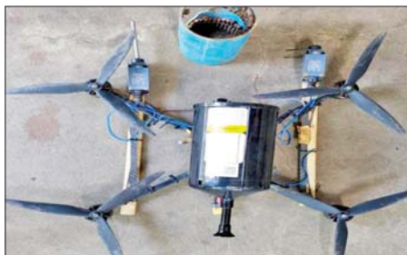
အကြမ်းဖက်သောင်းကျန်းသူများ ပစ်လွှတ်သည့် FPV Suicide Drone အား တွေ့ရစဉ်။