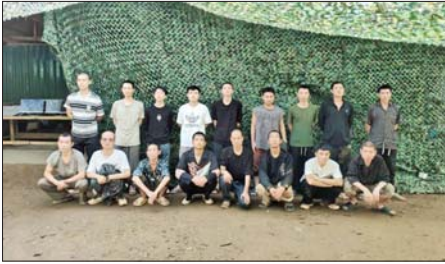
တရားမဝင်တရုတ်နိုင်ငံသား အမျိုးသား ၁၇ ဦးကို တွေ့ရစဉ်။

အနီး၌ အွန်လိုင်းလိမ်လည် လောင်းကစားမှု လုပ်ငန်းများ လုပ်ကိုင်ပြီး ထွက်ပြေးတိမ်းရှောင် နေသည့်တရားမဝင် တရုတ်နိုင်ငံ သား ၁၈ ဦး ပါဝင်သော အဖွဲ့ တစ်ဖွဲ့၊ ၁၉ ဦး ပါဝင်သော အဖွဲ့ တစ်ဖွဲ့၊ ၂၀ ဦး ပါဝင်သော အဖွဲ့ နှင့် ၁၇ ဦး ပါဝင်သော အဖွဲ့တစ်ဖွဲ့ တို့ဖြင့် စုစုပေါင်းတရားမဝင် တရုတ် နိုင်ငံသား ၇၅ ဦးကို တွေ့ရှိဖမ်းဆီး ရမိခဲ့ပြီးညနေ ၅ နာရီခန့်တွင် အဆိုပါ အနီးတစ်ဝိုက်၌ တရားမဝင်တရုတ် နိုင်ငံသား ၁၅ ဦးကို ထပ်မံတွေ့ရှိ ဖမ်းဆီးရမိခဲ့ရာ စုစုပေါင်း တရား မဝင် တရုတ်နိုင်ငံသား ၉၀ ကို တွေ့ရှိဖမ်းဆီးရမိခဲ့သည်။ ထို့ပြင် ၎င်းတို့အား ဖမ်းဆီးရ မိခဲ့သည့် နေရာတစ်ဝိုက်မှ အွန်လိုင်း လိမ်လည် လောင်းကစားမှု လုပ်ငန်းများ လုပ်ဆောင်ရာတွင် အသုံးပြုသည့် အလျားပေ ၅၀၊ အနံ ၁၅ ပေရှိ စားဆောင် တစ်လုံး၊ အလျား ၁၀ ပေ၊ အနံ ခြောက်ပေရှိ လူနေတံ အလုံး ၂၀၊ အလျားပေ ၂၀၊ အနံ ၁၅ ပေရှိ ဆန်ဂိုဒေါင် တစ်လုံး၊ အလျား ရှစ်ပေ၊ အနံ ငါးပေရှိ လျှပ်စစ်ဂိုဒေါင် တစ်လုံး၊ အလျား ၁၀ ပေ၊ အနံ ငါးပေရှိ ဆေးဂိုဒေါင် တစ်လုံး၊ အလျား ပေ ၄၀၊ အနံ ၁၅ ပေရှိ စားချက် ဆောင် တစ်လုံး၊ အလျား ၁၀ ပေ၊ အနံ ငါးပေရှိ ဂိတ်ဝင်/ထွက်ဆောင် တစ်လုံး၊ အလျားပေ ၄၀၊ အနံ ၁၅ ပေရှိ ရိက္ခာဂိုဒေါင် တစ်လုံး၊ အလျား ၁၅ ပေ၊ အနံ ၁၀ ပေရှိ မီးစက်ထားသည့် အဆောင် တစ်လုံး၊ အလျား ၁၀ ပေ၊ အနံ ငါးပေရှိ အထွေထွေဂိုဒေါင် တစ်လုံး၊ ဆန်အိတ် ၁၀၀၊ မီးစက် ငါးလုံး၊ Freezer သုံးလုံး၊ ဂက်စ်အိုး အလုံး ၂၀၊ ၁၄ ကန့်ပါ ထမင်းပေါင်းအိုး တစ်လုံး၊ ငါးထပ်သားပြား ၈၉ ပြား၊ ဆိုင်ကယ် လေးစီးနှင့် Star