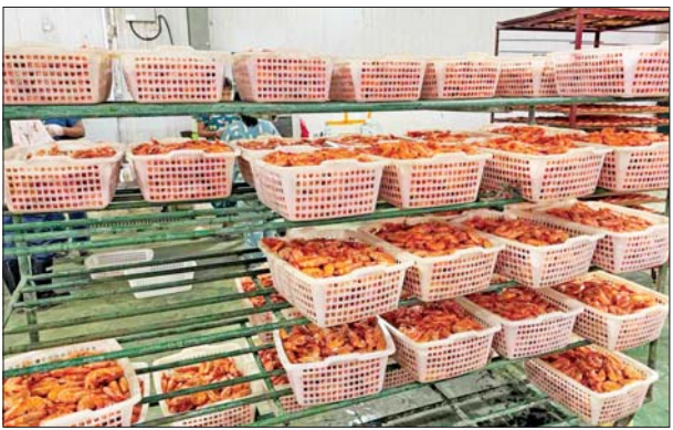
မြိတ်ကျွန်းစုမှ ဂျပန်နိုင်ငံသို့ တင်ပို့သည့် ပန်းခဲ၊ ပုစွန်ဖြူများ အေးခဲရန် ပြင်ဆင်နေစဉ်။

မြိတ်ကျွန်းစု မွေးမြူရေးကန်များမှ ထွက်ရှိသည့် ပန်းခဲ၊ ပုစွန်ဖြူများကို တရုတ် နှင့်ဂျပန်နိုင်ငံတို့သို့ တင်ပို့လျက်ရှိပြီး တရုတ်သို့ ပြုတ်ထားသော ပန်းခဲ၊ ပုစွန်ဖြူနှင့် ဂျပန်သို့ အေးခဲ ပြုလုပ်၍ ရေလမ်းကြောင်းမှ တင်ပို့လျက်ရှိ သည်။