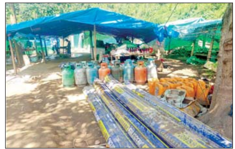
မေ ၁၃ ရက်က မက်မန်းမြို့နယ်အတွင်း တရားမဝင်အွန်လိုင်းလိမ်လည်မှုလုပ်ငန်းများ ဆောင်ရွက်ခဲ့သည့် သိမ်းဆည်းရမိအဆောက်အအုံများနှင့် လုပ်ငန်းသုံးပစ္စည်းများကို တွေ့မြင်ရစဉ်။