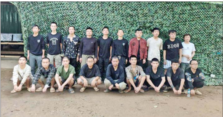
အွန်လိုင်းလိမ်လည်လောင်းကစားမှုကျူးလွန်ရာတွင် ပါဝင်ပတ်သက်ခဲ့သည့် တရုတ်နိုင်ငံသား ၁၉ ဦးကို တွေ့ရစဉ်။

နေပြည်တော် မေ ၁၃ နိုင်ငံတော်အစိုးရအနေဖြင့် နိုင်ငံတကာနှင့် တစ်ကမ္ဘာလုံးကို အန္တရာယ်ပေးနေသည့် အွန်လိုင်းလိမ်လည်လောင်းကစားမှုတို့ကို ရှေး လုပ်ငန်းစဉ်များကို အမျိုးသားရေးတာဝန်တစ်ရပ်အဖြစ်ခံယူကာ မြန်မာနိုင်ငံအတွင်း လုံးဝအခြေမပြုနိုင်ရေးအတွက် ပြည်တွင်းအင်အားစု များအပြင် အိမ်နီးချင်းနိုင်ငံ အစိုးရများနှင့်လည်း ပေါင်းစပ်ညှိနှိုင်း၍ တက်ကြွစွာဆောင်ရွက်လျက်ရှိရာ မေ ၁၂ ရက်နှင့် ယနေ့တိုင် ရှမ်းပြည်နယ်(မြောက်ပိုင်း) မက်မန်းမြို့နယ်အတွင်းရှိ သံလွင်မြစ်အနီး၌ အွန်လိုင်းလိမ်လည်လောင်းကစားမှုများ လုပ်ကိုင်နေသည့် တရုတ်နိုင်ငံ သား ၉၀ ကို လုပ်ငန်းလုပ်ကိုင်ရာတွင် အသုံးပြုသည့်ပစ္စည်းများနှင့်အတူ ဖမ်းဆီးရမိခဲ့ကြောင်း သိရသည်။ ရှမ်းပြည်နယ်(မြောက်ပိုင်း) မက်မန်းမြို့နယ်အတွင်းရှိ သံလွင်မြစ် အရှေ့ဘက်ကမ်းတစ်လျှောက်၌ အွန်လိုင်းလိမ်လည်လောင်းကစားမှု များ လုပ်ဆောင်နေကြောင်း သတင်းအရ လုံခြုံရေးတပ်ဖွဲ့ဝင်များပါဝင် သော ပူးပေါင်းအဖွဲ့က ရှာဖွေစစ်ဆေးမှုများဆောင်ရွက်ခဲ့ရာ မေ ၁၂ ရက် ညနေ ၄ နာရီခန့်တွင် မက်မန်းမြို့၏ အနောက်တောင်ဘက် ၅၅ ကီလိုမီတာခန့်အကွာရှိ သံလွင်မြစ်အနီး၌ အွန်လိုင်းလိမ်လည် လောင်းကစားမှုများလုပ်ကိုင်ရာတွင် အသုံးပြုသည့် အလျားပေ ၈၀၊ အနံမေ ၄၀ ရှိ လူနေမိုးကာတံ သုံးလုံးနှင့် စာမျက်နှာ ၁၄ ကော်လံ ၁ သို့ ၀