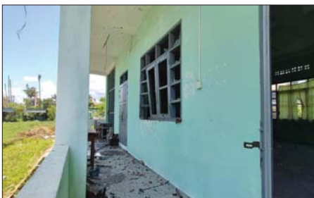
Drone ကျရောက်ပေါက်ကွဲမှုကြောင့် အခြေခံပညာအထက်တန်းကျောင်း(ခွဲ) အောင်ဇေယျရှိ စာသင်ဆောင်များ ပျက်စီးမှုကို တွေ့ရစဉ်။