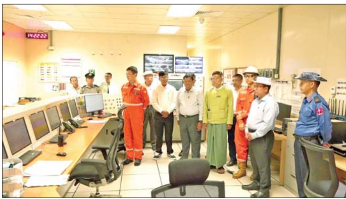
ဆက်လက်၍ ဂျွန်ကျေးရွာအနီး ကုန်းတွင်း ပြန်လည်မေးမြန်းဆွေးနွေးကာ လုပ်ငန်းခွင်ကို သဘာဝဓာတ်ငွေ့လက်ခံရေးစခန်း (Internal Gas Station - IGS) သို့ သွားရောက်၍ သိရှိလိုသည်များကို လှည့်လည်ကြည့်ရှု စစ်ဆေးခဲ့ကြောင်း သိရသည်။ တင်ထွန်း (ပြန်/ဆက်)

ခင်းခြင်း လုပ်ငန်းဆောင်ရွက်နေမှုနှင့် ရေရရှိရေး လုပ်ငန်းများဆောင်ရွက်နေမှု၊ သိုင်းချောင်းလမ်းဆုံမှ သစ်ပင်တောင်ကျေးရွာအထိ လမ်းတံတားများ ကြိုဆောင်ဆောင်ရွက်ရေး ဆောင်ရွက်မည့်အစီအစဉ်များကို ကြည့်ရှုစစ်ဆေးသည်။ ယင်းနောက် ကုန်းတွင်းသာဘဝဓာတ်ငွေ့စခန်း (Onshore Gas Terminal - OGT) အတွင်း လုပ်ငန်းဆောင်ရွက်နေမှု (၃)နှစ်အောက် ကလေးငယ်များနှင့် ကိုယ်ဝန်ဆောင်အမျိုးသမီးများအား ကာကွယ်ဆေးထိုးနှံတိုက်ကျွေးပေးနေမှု၊ အမှတ် (၂) အခြေခံပညာအထက်တန်းကျောင်း၊ သိပ္ပံခန်း၊ KWS စီစဉ်ပေးသည့် သို့ကုတ်ထုတ်လုပ်ရေး၊ သဘာဝငှက်များမွေးမြူထားရှိမှုတို့ကို လှည့်လည်ကြည့်ရှုအားပေးသည်။