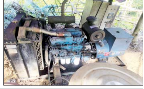
မေ ၁၂ ရက်က သံလွင်မြစ်၏ အရှေ့ဘက်ကမ်းတစ်လျှောက်တွင် တရားမဝင်အွန်လိုင်းလိမ်လည်မှုလုပ်ငန်းများ ဆောင်ရွက်ခဲ့သည့် သိမ်းဆည်းရမိ အဆောက်အအုံများနှင့် လုပ်ငန်းသုံးပစ္စည်းများကို တွေ့မြင်ရစဉ်။

Link နှစ်လုံးတို့ ကိုလည်းကောင်း၊ အဆိုပါနေရာမှ ထပ်မံရှာဖွေ စစ်ဆေးရာ အွန်လိုင်းလိမ်လည် လောင်းကစားမှုများ လုပ်ကိုင်ရာ တွင် အသုံးပြုသည့် အလျားပေ ၈၀၊ အနံပေ ၃၀ ရှိ အမျိုးသမီး အိပ်ဆောင် တစ်လုံး၊ အလျားပေ ၈၀၊ အနံပေ ၄၀ ရှိ အမျိုးသား အိပ်ဆောင် တစ်လုံး၊ အလျားပေ