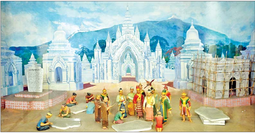
ပဉ္စမသင်္ဂါယနာတင် သရုပ်ဖော်ပုံကို တွေ့ရစဉ်။

ပဉ္စမသင်္ဂါယနာ ဒါယကာ မင်းတုန်းမင်း ဘကြီးတော်မင်းနောက်တွင် သာယာဝတီမင်း နန်းတက်ခဲ့သည်။ သာယာဝတီမင်းနောက်တွင် ပုဂံမင်း၊ ပုဂံမင်းနောက်တွင် ကုန်းဘောင်မင်းဆက်