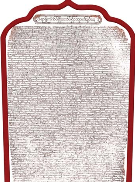
ပဉ္စမသင်္ဂါယနာတင် ကုသိုလ်တော်ကျောက်စာချပ်ကို တွေ့ရစဉ်။