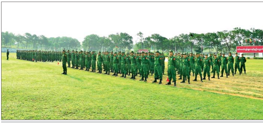
ပြည်သူ့စစ်မှုထမ်းသင်တန်း အမှတ်စဉ်(၂၄) သင်တန်းဖွင့်ပွဲ ကျင်းပစဉ်။

□ ကျောဖိုးမှ အဆိုပါ သင်တန်းဖွင့်ပွဲများသို့ နေပြည်တော်ကောင်စီ ဥက္ကဋ္ဌ တိုင်းဒေသကြီးနှင့် ပြည်နယ် ဝန်ကြီးချုပ်များ၊ တိုင်းမှူးများနှင့် တာဝန်ရှိသူများ တက်ရောက်၍ ပြည်သူ့စစ်မှုထမ်း သင်တန်း အမှတ်စဉ်(၂၄)မှ သင်တန်းသားများအား တွေ့ဆုံကာ သင်တန်းသားများအတွက် ဂုဏ်ပြုချီးမြှင့်ငွေ၊ စားသောက်ဖွယ်ရာများနှင့် အသုံးအဆောင်ပစ္စည်းများ ပေးအပ်ကြပြီး သင်တန်းသားများအား လိုက်လံနူတ်ဆက် အားပေးခဲ့ကြသည်။