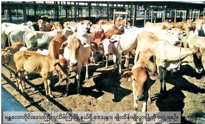
မန္တလေးတိုင်းဒေသကြီး ပုသိမ်ကြီးမြို့နယ်ရှိ ဒေသနွား မျိုးထိန်းမျိုးပွားခြင်းကို တွေ့ရစဉ်။

နိုင်ငံတော်၏ စီးပွားရေးမူဝါဒများတွင် စိုက်ပျိုး မွေးမြူရေးကို အခြေခံသည့် ကုန်ထုတ်လုပ်မှုများ အားကောင်းစေရေးသည် အဓိကကျပါသည်။ မွေးမြူရေးလုပ်ငန်းသည် တန်ဖိုးကွင်းဆက် တစ်လျှောက်တွင် အလုပ်အကိုင် အခွင့်အလမ်း များစွာကို ဖန်တီးပေးနိုင်ပြီး ပြည်တွင်းစီးပွားရေး သံသရာကို လည်ပတ်စေသည့် အားကောင်းသော အထောက်အကူပြု ကဏ္ဍတစ်ခုဖြစ်လာပါသည်။ ကျန်းမာကြံ့ခိုင်သော မျိုးဆက်သစ်တို့အတွက် အာဟာရကဏ္ဍ