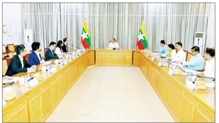
ညွှန်ကြားရေးမှူးချုပ်များ၊ တာဝန်ရှိသူများ ထိုင်းသံရုံးနှင့် ထိုင်းနိုင်ငံ ညွှန်ကြားရေးမှူးချုပ်များ၊ တာဝန်ရှိသူများ ထိုင်းသံရုံးနှင့် ထိုင်းနိုင်ငံ မှ ကိုယ်စားလှယ်များ တက်ရောက် သတင်းစဉ်

နေပြည်တော် ဧပြီ ၂၇ - အမျိုးသားစီမံကိန်း၊ ရင်းနှီးမြှုပ်နှံမှုနှင့် နိုင်ငံခြားစီးပွား ဆက်သွယ်ရေး ဝန်ကြီးဌာန ရုံးအမှတ်(၁) နေပြည်တော်၌ လက်ခံတွေ့ဆုံသည်။