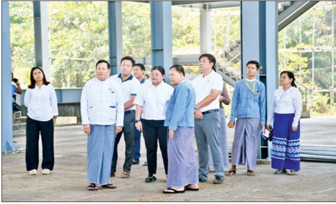
အမိုးအသစ်မိုးခြင်းနှင့် အမိုးထိုနောက် ဒုတိယဝန်ကြီးသည် အဟောင်းပြုပြင်ခြင်း လုပ်ငန်း နိုင်ငံတကာအဆင့်မီ အနုပညာ ဗဟိုဌာန(ရန်ကုန်) အဆောက်အအုံ တည်ဆောက်ရေး စီမံကိန်းတွင် အဆောက်အအုံ ဘေးနံရံများ ကာရံနေမှု၊ ဆောင်ရွက်ရန်ကျန် ရှိသော Steel Column များ၊

ရန်ကုန် ဧပြီ ၂၇ - ဟိုတယ်၊ ခရီးသွားလာရေးနှင့် ယဉ်ကျေးမှုဝန်ကြီးဌာန ဒုတိယ ဝန်ကြီး ဦးအေးထွန်းသည် တာဝန် ရှိသူများနှင့်အတူ ယနေ့နံနက်ပိုင်း က ရန်ကုန်တိုင်းဒေသကြီး အင်းစိန်မြို့နယ်ရှိ အနုပညာ ဗဟိုဌာန(ရန်ကုန်) (Myanmar Art Center - Yangon) တည်ဆောက်ရေး လုပ်ငန်းများကို ကြည့်ရှုစစ်ဆေးသည်။