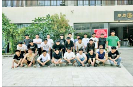
တာချီလိတ်မြို့၊ ဝိန်းကျောက်ရပ်ကွက် တော်ကော့(တွင်း)၌ တရားမဝင် အွန်လိုင်းလောင်းကစားမှုလုပ်ကိုင်သူ မြန်မာနိုင်ငံသား အမျိုးသား ၂၇ ဦးကို ဖမ်းဆီးရမိစဉ်။