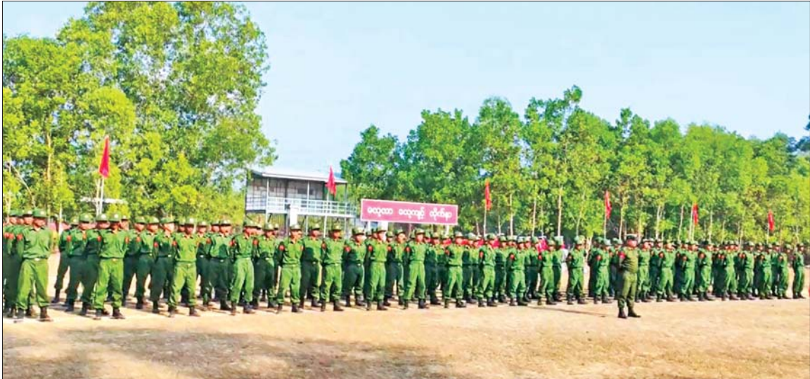
ပြည်သူ့စစ်မှုထမ်းသင်တန်းအမှတ်စဉ်(၂၄)သင်တန်းဖွင့်ပွဲ ကျင်းပစဉ်။

နေပြည်တော် ဧပြီ ၂၇ နိုင်ငံတော် ကာကွယ်ရေးနှင့် လုံခြုံရေးတာဝန် ထမ်းဆောင် နိုင်ရန်အတွက် ပြည်သူ့စစ်မှုထမ်း သင်တန်း အမှတ်စဉ်(၂၄)တွင် ပါဝင်တက်ရောက်ကြမည့် အရည် အချင်းကိုကိုင်ညီသူ နိုင်ငံသားကောင်း များသည် သက်ဆိုင်ရာတိုင်းစစ် ဌာနချုပ်နယ်မြေများရှိ သင်တန်း ကျောင်းအသီးသီးသို့ ရောက်ရှိ၍ လိုအပ်သည့် ကြိုတင်ပြင်ဆင်မှု များ ဆောင်ရွက်ခဲ့ကြသည်။ ယနေ့နံနက်ပိုင်းတွင် အဆိုပါ သင်တန်းကျောင်း အသီးသီး၌ ပြည်သူ့စစ်မှုထမ်း သင်တန်း အမှတ်စဉ်(၂၄) သင်တန်းဖွင့်ပွဲများ ကျင်းပကြသည်။ သင်တန်းဖွင့်ပွဲ များတွင် သင်တန်းကျောင်းများ အလိုက် ကျောင်းအုပ်ကြီးများ က သင်တန်းဖွင့်အမှာစကားများ ပြောကြားကြသည်။ စာမျက်နှာ ၁၁ ကော်လံ ၁ သို့ □