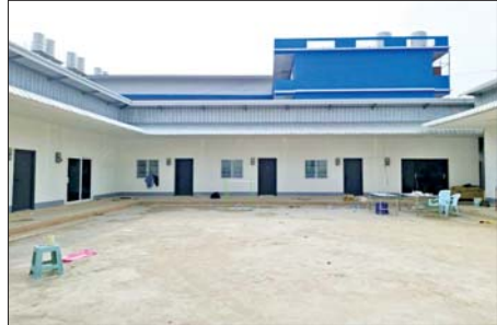
တာချီလိတ်မြို့၊ ဝိန်းကျောက်ရပ်ကွက် တော်ကော့(တွင်း)ရပ် လိုမာဟိုတယ်အနီးရှိ တရားမဝင် အွန်လိုင်းလောင်းကစားမှုကျူးလွန် ရာတွင် အသုံးပြုသည့် အဆောက်အအုံများ သိမ်းဆည်းရမိမှုကို တွေ့ရစဉ်။