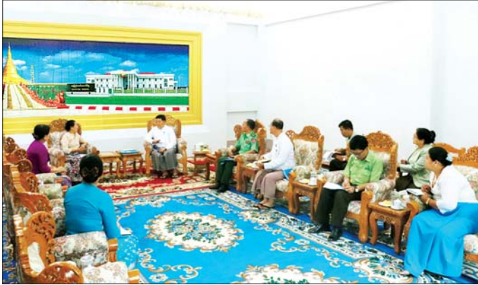
စာကြည့်တိုက်များ ဖွင့်လှစ်ပေးနိုင်ရန်ကူညီပံ့ပိုးရေး၊ ကျောင်းနေအရွယ်ကလေးငယ်များ ကျောင်းနေနိုင်ရေး၊ အမျိုးသမီးများ စီးပွားရေးလုပ်ငန်းများတွင် ပါဝင်နိုင်ရေးနှင့် အလုပ်အကိုင်အခွင့်အလမ်းရရှိရေး စသည်တို့ကို ဆောင်ရွက်သွားမည်ဖြစ်ပြီး ဒေသသုံးခုရှိ ကျေးရွာများတွင် ကနဦးဆောင်ရွက်မည်ဖြစ်၍

နေပြည်တော် ဧပြီ ၂၇ အမျိုးသမီးရေးရာဝန်ကြီးဌာန ပြည်ထောင်စုဝန်ကြီး ဒေါက်တာသက်စင်သည် နေပြည်တော် ကောင်စီဥက္ကဋ္ဌ ဦးကျော်စွာနှင့် နေပြည်တော် ကောင်စီဥက္ကဋ္ဌ ဦးကျော်စွာနှင့် တွေ့ဆုံ၍ နေပြည်တော်အတွင်းရှိ ကျေးလက်နေအမျိုးသမီး ဖွံ့ဖြိုးတိုးတက်ရေးအတွက် ရှေ့ပြေးစီမံကိန်းနှင့် ပတ်သက်၍ တွေ့ဆုံဆွေးနွေးသည်။ တွေ့ဆုံစဉ် ပြည်ထောင်စုဝန်ကြီးက အမျိုးသမီးများနှင့် အမျိုးသမီးငယ်ရွယ်များ ဖွံ့ဖြိုးတိုးတက်ရေးအတွက် လက်ရှိဆောင်ရွက်နေသော လုပ်ငန်းများ အနက်မှ ကျေးလက်နေအမျိုးသမီးများ ဖွံ့ဖြိုးတိုးတက်ရေးကို အရှိန်အဟုန်ဖြင့် ဆောင်ရွက်ရာတွင် နေပြည်တော်ကောင်စီ ပြည်ထောင်စုနယ်မြေ၊ မန္တလေးတိုင်းဒေသကြီးနှင့် ရှမ်းပြည်နယ်စသည့် ဒေသသုံးခုရှိ ကျေးလက်နေ အမျိုးသမီးများအတွက် ဦးစားပေးဆောင်ရွက်ရန် စီမံကိန်းရေးဆွဲထားကြောင်း၊ စီမံကိန်းတွင် စာဖတ်ရရှိနိုင်စေရန်၊ ကျေးလက်