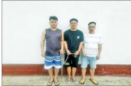
တာချီလိတ်မြို့၊ ဝိန်းကျောက်ရပ်ကွက် တော်ကော့(တွင်း)ရပ် လိုမာဟိုတယ်အနီးရှိ နေအိမ်၌ဖမ်းဆီးရမိခဲ့သည့် တရားမဝင် တရုတ် နိုင်ငံသား အမျိုးသား သုံးဦးကို တွေ့ရစဉ်။