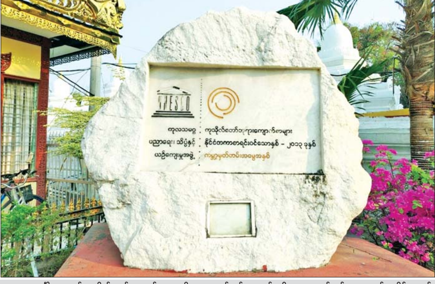
ပဉ္စမသင်္ဂါယနာတင် ကုသိုလ်တော်ကျောက်စာများကို ၂၀၁၃ ခုနှစ်တွင် ယူနက်စကိုက ကမ္ဘာ့ပုထိုးတစ်ရပ်အဖြစ်အဖြစ်အမှတ်ပြုခဲ့မှုကို တွေ့ရစဉ်။