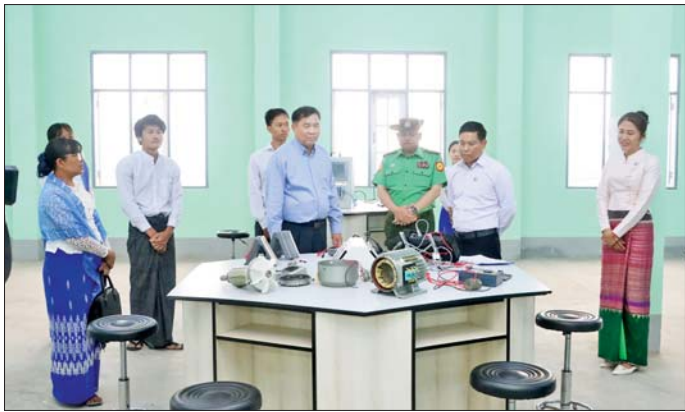
(တောင်ကြီး)သို့ သွားရောက်၍ လက်တွေ့ခန်းများ ပြင်ဆင်ထားရှိမှုကို ကြည့်ရှုစစ်ဆေးပြီး ကျောင်းအစည်း အဝေးခန်းမတွင် ကျောင်းနှင့်စပ်လျဉ်းသည့် အချက်

ဆရာမများ၊ ဝန်ထမ်းများနှင့် တွေ့ဆုံရာ ပါမောက္ခချုပ် က တက္ကသိုလ်နှင့်စပ်လျဉ်း၍ တင်ပြပြီး ပြည်ထောင်စု ဝန်ကြီးက ပြင်ဆင်ဆောင်ရွက်မည့် စာသင်ဆောင် များ၊ Lab ခန်းများ၊ အလုပ်ရုံများ၊ အသစ်တည်ဆောက် မည့် ကျောင်းသား ကျောင်းသူအဆောင်၊ ဒုတိယ ပါမောက္ခချုပ်အိမ်ရာ၊ အရာရှိအိမ်ရာများနှင့် ဆရာ ဆရာမအိမ်ရာများ ဆောက်လုပ်မည့်မြေနေရာတို့ကို ကြည့်ရှုစစ်ဆေးကာ အနာဂတ်တွင်ဖြစ်ပေါ်လာမည့် လိုအပ်ချက်များနှင့်အညီ တင်ပြဆောင်ရွက်ရန်၊ ဗလငါးတန်နှင့်ပြည့်စုံသည့် ကျောင်းသား ကျောင်းသူ များ မွေးထုတ်နိုင်ရေးနှင့် သင်ကြားသင်ယူမှု ပတ်ဝန်း ကျင်ကောင်းများ ဖြစ်နေစေရေး အစဉ်ကြိုးပမ်း ဆောင်ရွက်စေလိုပါကြောင်း၊ တက္ကသိုလ် သန်ရှင် သာယာလှပရေးနှင့် စိမ်းလန်းစိုပြည်ရေးကို ဂရုစိုက် ဆောင်ရွက်ပေးစေလိုကြောင်း မှာကြားသည်။ ယင်းနောက် ပြည်ထောင်စုဝန်ကြီးနှင့်အဖွဲ့သည် ရှမ်းပြည်နယ်ဝန်ကြီးချုပ် ဦးစိုင်းထိန်စိုး၊ ပြည်နယ် တာဝန်ရှိသူများနှင့်အတူ အစိုးရစက်မှုလက်မှုသိပ္ပံ