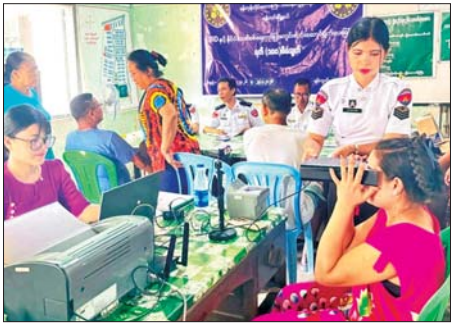
ယနေ့နံနက်ပိုင်းမှစ၍ ကွင်းဆင်း သိရသည်။ ဆောင်ရွက်ပေးလျက်ရှိကြောင်း လူလှထွေး(ပြန်/ဆက်)

ရန်ကင်းမြို့နယ် ဧပြီ ၂၇ လူဝင်မှု ကြီးကြပ်ရေးနှင့် ပြည်သူ့အင်အား ဝန်ကြီးဌာန ရန်ကင်းမြို့နယ် ဦးစီးမှူးရုံး အနေဖြင့် ရန်ကင်းမြို့နယ် အမှတ်(၄)ရပ်ကွက် အုပ်ချုပ်ရေး မှူးရုံးတွင် အသက် ၁၀ နှစ်မှ ၁၈ နှစ်အထက်နိုင်ငံသားစိစစ်ရေးကတ် မရရှိသေးသူများနှင့် နိုင်ငံသား စိစစ်ရေးကတ် ကိုင်ဆောင်ပြီး UID မကောက်ယူရသေးသည့် ပြည်သူများအား အစိုးရသစ် ကာလ ရက်(၁၀၀)စီမံချက်ဖြင့် မြေပြင်ကွင်းဆင်း စိစစ်ခြင်းကို