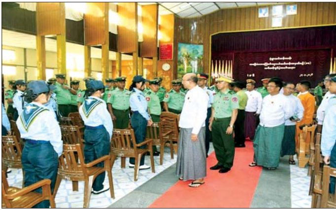
စစ်ကိုင်းတိုင်းဒေသကြီးဝန်ကြီးချုပ် ဦးကိုလေး၊ ဗိုလ်ချုပ်ကြီးဖွင့်လှစ်သည့် အခြေခံလေကြောင်းလူငယ်သင်တန်းအမှတ်စဉ်(၁၀)မှ သင်တန်းသား သင်တန်းသူများအား လိုက်လံတွေ့ဆုံ နှုတ်ဆက်စဉ်။

အဆိုပါ ရေကြောင်းလူငယ်အခြေခံနှင့် တန်းမြင့်သင်တန်းအမှတ်စဉ် (၁/၂၀၂၆)ကို ယနေ့မှ မေ ၂၉ ရက်အထိ ရက်သတ္တ ၅ ပတ်ကြာ သင်ကြားပို့ချပေးသွားမည်ဖြစ်ကြောင်း သိရသည်။ ယင်းသင်တန်းများကို ၁၉၉၇ ခုနှစ်မှစတင်၍ ဖွင့်လှစ်ခဲ့ခြင်းဖြစ်ပြီး ၂၀၂၄ ခုနှစ်အထိ ရေကြောင်းလူငယ်အခြေခံနှင့်