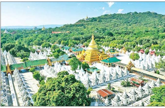
မင်းတုန်းမင်းကြီးကောင်းမှု မဟာလောကမာရဇိနိကုသိုလ်တော်ဘုရားနှင့် ကျောက်စာစေတီတော်များကို တွေ့ရစဉ်။

❖ စာမျက်နှာ ၆ မှ ပဉ္စမသင်္ဂါယနာတင်ရခြင်း၏ ရည်ရွယ်ချက် မြတ်စွာဘုရားရှင် ဟောကြားတော်မူခဲ့သော တရားတော်များ သန့်ရှင်းစင်ကြယ်စွာ တည်တံ့ခိုင်မြဲစေရေးအတွက် အရှင်မဟာကဿပမထေရ် မြတ်ကြီး ဦးဆောင်တော်မူသော ပထမသင်္ဂါယနာ မှသည် မထေရ်မြတ်များအဆင့်ဆင့် လက်ဆင့်ကမ်း သယ်ဆောင်လာတော်မူရာ သာသနာတော်နှစ် ၄၅၀ ပြည့်နှစ် သီဟိုဠ်ကျွန်း(သီရိလင်္ကာနိုင်ငံ) မလယ ဇနပုဒ် အလောကလိုဏ်ဂူ၌ ရဟန္တာအရှင် မြတ် ၅၀၀ တို့ စုပေါင်းရွတ်ဆို အတည်ပြုတော်မူကာ ပထမအက္ခရာတင်ခဲ့သောစတုတ္ထသင်္ဂါယနာသည် နောက်ဆုံးအကြိမ်တင်ခဲ့သော ထေရဝါဒသင်္ဂါယနာ ဖြစ်သည်။ ထိုသို့ နောက်ဆုံးသင်္ဂါယနာတင်ပြီး သည်မှာ နှစ်ပေါင်း ၂၀၀၀ ကျော်ကြာခဲ့ပြီဖြစ်၍ ခေတ်အဆက်ဆက် ပေရွက်များပေါ်တွင် ရေးသားမှတ်တမ်းတင်ထားသည့် ပိဋကတ်တော်များသည် ရာသီဥတုနှင့် ပိုးမွှားများကြောင့် ပျက်စီးလာခဲ့သည်။ ထို့အပြင် ဆရာတပည့်အဆင့်ဆင့် အစဉ်အဆက် လက်ဆင့်ကမ်းကူးကျူးခဲ့ကြသော ပေစာများ၏ စာသားအချို့တွင် မူကွဲများ၊ အက္ခရာပေါက်များ ရှိလာရာ ဘုရားရှင်၏တရားတော်များ သန့်ရှင်းစင်ကြယ်စွာ တည်တံ့ခိုင်မြဲစေရန်နှင့် မူလပျက်စန့်ကန့်စွာ ထိန်းသိမ်းစောင့်ရှောက်နိုင်ရန် ရည်ရွယ်၍ ပဉ္စမသင်္ဂါယနာတင်ရန် ဆောင်ရွက်ခဲ့ကြခြင်း ဖြစ်သည်။