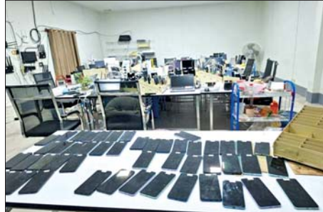
တာချီလိတ်မြို့၊ ဝိန်းကျောက်ရပ်ကွက် တော်ကော့(တွင်း)၌ တရားမဝင်အွန်လိုင်းလောင်းကစားမှုကျူးလွန်ရာတွင် အသုံးပြုသည့် လုပ်ငန်းသုံးပစ္စည်းများ သိမ်းဆည်းရမိမှုကို တွေ့ရစဉ်။