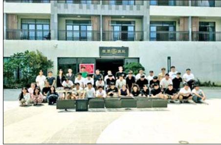
တာချီလိတ်မြို့၊ ဝိန်းကျောက်ရပ်ကွက် တော်ကော့(တွင်း)၌ တရားမဝင် အွန်လိုင်းလောင်းကစားမှုလုပ်ကိုင်သူများအား အွန်လိုင်း လောင်းကစားမှုလုပ်ရာတွင် အသုံးပြုသည့် ပစ္စည်းများနှင့်အတူ ဖမ်းဆီးရမိစဉ်။