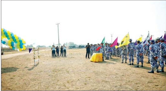
စခန်းဌာနချုပ်များနှင့် လေတပ်စခန်းအသီးသီးမှ ရက်အထိ ယှဉ်ပြိုင်ကစားသွားမည်ဖြစ်ကြောင်း ပြိုင်ပွဲဝင်အမျိုးသားအသင်း ၁၃ သင်း၊ အမျိုးသမီး သိရသည်။ အသင်း ၁၁ သင်းတို့ဖြင့် ဧပြီ ၂၇ ရက်မှ မေ ၁ သတင်းစဉ်

တောင်ငူလေတပ်စခန်းဌာနချုပ် လေတပ်စခန်း ဌာနချုပ်မှူး ဗိုလ်မှူးကြီး ရန်နိုင်က အမှာစကား ပြောကြားသည်။ ထို့နောက် လေတပ်စခန်း ဌာနချုပ်မှူးက မိုးပျံပေးအား သေနတ်ဖြင့် ပစ်ဖောက်၍ အခမ်းအနားကို ဖွင့်လှစ်ပေးပြီး တက်ရောက်လာသူများနှင့်အတူ ဖြိုင်ပွဲပထမနေ့ ပွဲစဉ်များဖြစ်သည့် အမျိုးသားပစ္စည်းပစ္စည်း(အမြန်နှင့် လျှပ်တစ်ပြက်)၊ အမျိုးသမီးပစ္စည်းပစ္စည်း(အမြန်နှင့် လျှပ်တစ်ပြက်)၊ အမျိုးသမီးကာတိုင်ပွဲစဉ်များကို ကြည့်ရှုအားပေးသည်။ အဆိုပါ ကာကွယ်ရေးဦးစီးချုပ်(လေ)တံခွန် စိုက်ခိုင်း သေနတ်ပစ်ပြိုင်ပွဲကို ကာကွယ်ရေးဦးစီး ချုပ်ရုံး(လေ) ကွပ်ကဲမှုအောက်ရှိ ဌာနချုပ်၊ လေတပ်