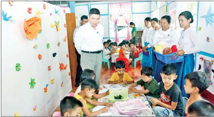
ပြည်ထောင်စုဝန်ကြီး ဦးထိန်လင်း ပြန်ကြားရေးနှင့် ပြည်သူ့ဆက်ဆံရေးဦးစီးဌာန လယ်ဝေးမြို့နယ်ရုံး တွင် ကြည့်ရှုအားပေးပေးပို့။

မှန်ကန်သော သတင်းအချက်အလက်များ အချိန်နှင့်တစ်ပြေးညီ ပြည်သူလူထုသိရှိနိုင်စေရန် အတွက် ပြန်ကြားရေးဝန်ကြီးဌာန ပြည်ထောင်စု ဝန်ကြီး ဦးထိန်လင်းသည် ယနေ့နံနက်ပိုင်းတွင် ပျဉ်းမနား-သပြေတောင် ရုပ်မြင်သံကြားထပ်ဆင့်လွှင့် စက်ရုံနှင့် ပြန်ကြားရေးနှင့် ပြည်သူ့ဆက်ဆံရေးဦးစီး ဌာန ပျဉ်းမနားမြို့နယ်ရုံးနှင့် လယ်ဝေးမြို့နယ်ရုံး တို့သို့ သွားရောက်၍ လုပ်ငန်းစွမ်းဆောင်ရည် မြှင့်တင် နိုင်ရေး ကွင်းဆင်းကြည့်ရှုစစ်ဆေးသည်။