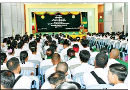
ဆရာ ဆရာမ ၂၆၂ ဦး တက်ရောက်ကြပြီး သင်တန်းကာလမှာ ဧပြီ ၂၇ ရက်မှ မေ ၉ ရက်အထိ ၁၀ ရက်ကြာ သင်ကြားပို့ချဆွေးနွေးသွားမည် ဖြစ်ကြောင်း သိရသည်။ တိုင်းဒေသကြီး(ပြန်/ဆက်)

အဆိုပါသင်တန်းသို့ ဧရာဝတီတိုင်းဒေသကြီးအတွင်းရှိ မြို့နယ် ၂၆ မြို့နယ်မှ KG နှင့် Grade-1 အတန်းတို့တွင် သင်ကြားနေသော