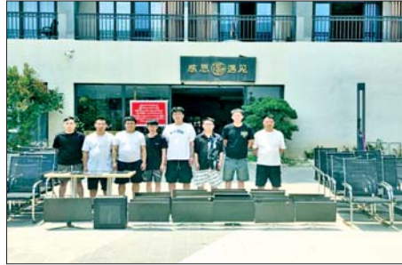
တာချီလိတ်မြို့၊ ဝိန်းကျောက်ရပ်ကွက် တော်ကော့(တွင်း)၌ ဖမ်းဆီးရမိသည့် တရုတ်နိုင်ငံသား အမျိုးသား ရှစ်ဦးကို တွေ့ရစဉ်။