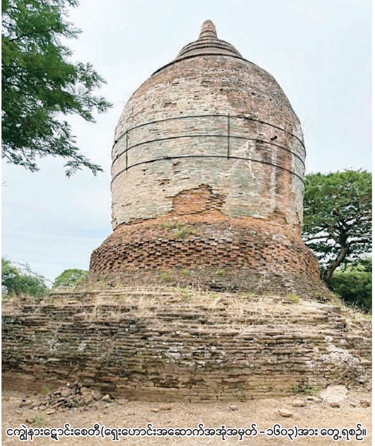
ကျွဲနားဧွင်းစေတီ(ရှေးဟောင်းအဆောက်အအုံအမှတ် - ၁၆၀၃)အား တွေ့ရစဉ်။

သုတေသနပြုသွားမည် ဖြစ်ကြောင်း သိရသည်။ တူးဖော်သုတေသနပြုနေမှုများနှင့် ပတ်သက်၍ လေ့လာလိုသည့် သုတေသီများ၊ ကျောင်းသား၊ ကျောင်းသူများ၊ ရှေးဟောင်းသုတေသနဆိုင်ရာ တူးဖော်သုတေသနပြုမှုများကို စိတ်ပါဝင်စားသည့် မည်သူမဆိုလာရောက်လေ့လာနိုင်ကြောင်း ရှေးဟောင်းသုတေသနနှင့် အမျိုးသားပြတိုက်ဦးစီးဌာန(ပုဂံဌာနခွဲ) ညွှန်ကြားရေးမှူးထံမှ သိရသည်။ ဒီပါလင်း