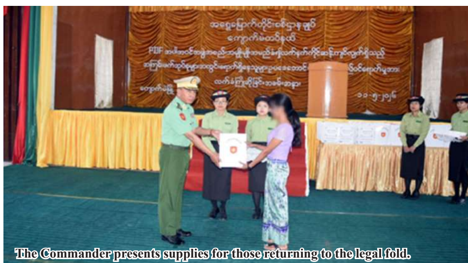
The Commander presents supplies for those returning to the legal fold.

Nay Pyi Taw May 11 The state government has been inviting those who remain in organizations that oppose the government under various names, including the PDF, to return to the legal framework, and has been providing necessary assistance to those who do so. Accordingly, a further 72 people—16 men and 40 women from the DPLA, 3 men from the TNLA, and 11 men and 2 women from groups claiming to be the PDF—have entered the legal framework, as they