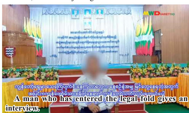
A man who has entered the legal fold gives an interview.

violent acts carried out for the benefit of terrorist groups— such as threats, arrests, and killings of innocent civilians and public service personnel, and the planting and detonating of landmines to destroy non-military infrastructure such as roads and bridges. Moreover, there have been ethnic discrimination, hierarchical abuse, torture, killings, and other forms of coercion among members within these groups, along with harsh living conditions, poverty, and hardship. In addition, they have become demoralized due to their inability to withstand military offensives by the Tatmadaw. Furthermore, they have trusted and accepted the peace processes of the State and the Tatmadaw, and wish to live peacefully within the legal framework while contributing positively to the country and the public, who have suffered losses due to their actions. For these reasons, they have abandoned the armed struggle line and returned to the legal fold.