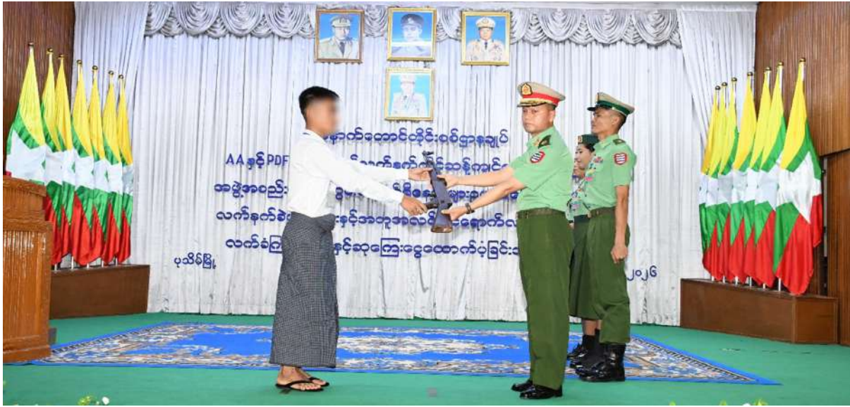
အနောက်တောင်တိုင်းစစ်ဌာနချုပ် တိုင်းမှူး ဗိုလ်မှူးချုပ်အောင်ကျော်ခိုင်ထံ ဥပဒေဘောင်အတွင်းဝင်ရောက်လာသူတစ်ဦးက လက်နက် အပ်နှံစဉ်။

နေပြည်တော် မေ ၁၁ နိုင်ငံတော်အစိုးရသည် PDF အပါအဝင် အဖွဲ့အစည်းအမျိုးမျိုးအမည်ခံ၍ လက်နက်ကိုင်ဆွဲကျင့်လျက်ရှိသည့် အဖွဲ့အစည်းများအတွင်း ရောက်ရှိနေသူများကို ဥပဒေဘောင်အတွင်းသို့ ပြန်လည်ဝင်ရောက်ရန် ဖိတ်ခေါ်၍ ဥပဒေဘောင်အတွင်းသို့ပြန်လည်ဝင်ရောက်လာကြသူများကိုလည်း လိုအပ်သည့် ကူညီပံ့ပိုးမှုများဆောင်ရွက်ပေးလျက် ရှိရာ နိုင်ငံတော်နှင့်တပ်မတော်၏ ငြိမ်းချမ်းရေးလုပ်ငန်းစဉ်များကို နားလည်သဘောပေါက်လာသည့် AA အဖွဲ့ နှင့် PDF အမည်ခံအဖွဲ့မှ အဖွဲ့ဝင် အမျိုးသား ၃၁ ဦးတို့သည် လက်နက်ခဲယမ်းများနှင့်အတူ ဥပဒေဘောင်အတွင်းသို့ ထပ်မံဝင်ရောက်လာကြသည်။ ထိုသို့ ဥပဒေဘောင်အတွင်းပြန်လည်ဝင်ရောက်လာကြသည့် ရခိုင်ပြည်နယ် သံတွဲမြို့နယ်မှ သုံးဦး၊ မြောက်ဦးမြို့နယ်မှ တစ်ဦး၊ မောင်တောမြို့နယ်မှ တစ်ဦး၊ ရသေ့တောင်မြို့နယ်မှ တစ်ဦး၊ ဧရာဝတီတိုင်းဒေသကြီး ဖျာပုံမြို့နယ်မှ တစ်ဦး စုစုပေါင်း AA အဖွဲ့ဝင် အမျိုးသား ခုနစ်ဦးနှင့် ဧရာဝတီတိုင်းဒေသကြီး ပုသိမ်မြို့နယ်မှ နှစ်ဦး၊ ငပုတောမြို့နယ် ငရုတ်ကောင်းမြို့မှ နှစ်ဦး၊ ကြံခင်းမြို့နယ်မှ တစ်ဦး၊ လေးမျက်နှာမြို့နယ်မှ ၁၂ဦး၊ အင်္ဂပူမြို့နယ်မှ သုံးဦး၊ ရေကြည်မြို့နယ်မှ နှစ်ဦး၊ မော်လမြိုင်ကျွန်းမြို့နယ်မှ တစ်ဦး၊ မန္တလေးတိုင်းဒေသကြီး အမရပူမြို့နယ်မှ တစ်ဦး စုစုပေါင်း PDF အဖွဲ့ဝင် အမျိုးသား ၂၄ ဦးတို့ကို တာဝန်ရှိသူများက ကြိုဆိုလက်ခံ၍ မိဘအုပ်ထိန်းသူများထံ