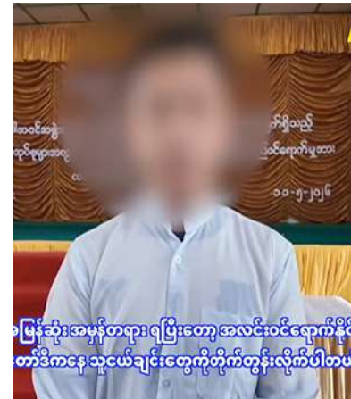
အကျွန်ုပ်တို့အဖွဲ့အစည်းများ ပြန်လည်ဝင်ရောက်နိုင် တာဝန်နှင့် သဘောတူညီကြောင်းကို တွန်းလှိုက်ပါသည်။

အမျိုးသား ခုနစ်ဦး၊ အမျိုးသမီး သုံးဦးတို့ကို တာဝန်ရှိသူများက ကြိုဆိုလက်ခံ၍ မိဘအုပ် ထိန်းသူများထံ ပြန်လည်လွှဲပြောင်းအပ်နှံပွဲ ကို ယနေ့နံနက်ပိုင်းတွင် ရှမ်းပြည်နယ် (မြောက်ပိုင်း) ကျောက်မဲမြို့၊ မြို့ကျက်သရေ ဆောင်ခန်းမ၌ပြုလုပ်ရာ အရှေ့မြောက်တိုင်း တိုင်းစစ်ဌာနချုပ် တိုင်းမှူး ဗိုလ်ချုပ်အေးမင်းဦး နှင့်တာဝန်ရှိသူများ၊ ဌာနဆိုင်ရာတာဝန်ရှိသူ များ၊ ဥပဒေဘောင်အတွင်းပြန်လည်ဝင်ရောက် လာခဲ့ကြသူများနှင့် ၎င်းတို့၏ မိဘအုပ်ထိန်း သူများ တက်ရောက်ကြသည်။ ဦးစွာ တိုင်းမှူးက အမှာစကားပြောကြား ပြီး ပြည်နယ်ဒုတိယရဲတပ်ဖွဲ့မှူးက ဥပဒေ အကြောင်းအရာများကို ရှင်းလင်းပြောကြား သည်။ ထို့နောက် တိုင်းမှူးနှင့် တာဝန်ရှိသူ များက ဥပဒေဘောင်အတွင်းပြန်လည်ဝင် ရောက်လာသူများကို ထောက်ပံ့ပစ္စည်းများ ပေးအပ်ပြီး ဝန်ခံကတိလက်မှတ်ရေးထိုးစေ ကာ မိဘအုပ်ထိန်းသူများထံ ပြန်လည် လွှဲပြောင်းအပ်နှံပေးကြသည်။ ယင်းနောက် ဥပဒေဘောင်အတွင်း ဝင်ရောက်လာကြသူ များကိုယ်စား ဥပဒေဘောင်အတွင်းဝင်ရောက်