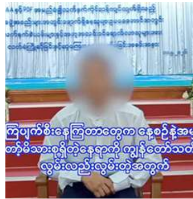
ကျောက်စိမ်းနေကြတာတွေက နေ့စဉ်နဲ့အတူတိုင်းအားရစရာတွေကို ကျွန်တော်တို့ကလွှဲမလည်းလွှဲမီးတိုအတွက်

ပြန်လည်လွှဲပြောင်းအပ်နှံပွဲကို ယနေ့နံနက်ပိုင်းတွင် အနောက်တောင်တိုင်းစစ်ဌာနချုပ် ဧရာဝတီခရိုင်မဏ္ဍိုင်လှုပ်ရာ ဧရာဝတီတိုင်းဒေသကြီးဝန်ကြီးချုပ် ဦးအေးကျော်၊ တိုင်းဒေသကြီး လွှတ်တော်ဥက္ကဋ္ဌ ဦးသိန်းထွန်း၊ တိုင်းမှူး ဗိုလ်မှူးချုပ်အောင်ကျော်ခိုင်နှင့် တာဝန်ရှိသူများ၊ ဌာနဆိုင်ရာတာဝန်ရှိသူများ၊ ဥပဒေဘောင်အတွင်း ပြန်လည်ဝင်ရောက်လာကြသူများနှင့် ၎င်းတို့၏ မိဘအုပ်ထိန်းသူများ တက်ရောက်ကြသည်။ ဦးစွာ တိုင်းဒေသကြီးဝန်ကြီးချုပ်က အမှာစကားပြောကြားပြီး တိုင်းမှူးက တရားဥပဒေများနှင့်ပတ်သက်၍ အသိပညာပေးစကားများ ရှင်းလင်းဆွေးနွေးပြောကြားသည်။ ထို့နောက် ဥပဒေဘောင်အတွင်း ပြန်လည်ဝင်ရောက်ခဲ့ကြသူများက ၎င်းတို့နှင့်အတူ ပါရှိလာသည့် MA-1 သေနတ် သုံးလက်၊ M-22 သေနတ် နှစ်လက်၊ လက်ပစ်ဗုံး တစ်လုံး၊ ကျည် ၃၃၈ တောင့်နှင့် ကျည်အိမ်ခြောက်ခုတို့ကို လွှဲပြောင်းအပ်နှံရာ တိုင်းမှူးက လက်ခံရယူသည်။ ယင်းနောက် တိုင်းဒေသကြီးဝန်ကြီးချုပ်နှင့် တိုင်းမှူးတို့က လက်နက်ခဲယမ်းများနှင့်အတူ ဥပဒေဘောင်အတွင်း ဝင်ရောက်လာသူများကို မောင်းပြန်ရိုင်းဖယ် ငါးလက်အတွက် ငွေကျပ် သိန်း ၂၅၀၊ လက်ပစ်ဗုံးတစ်လုံးအတွက် ငွေကျပ် သုံးသိန်း၊ ဥပဒေဘောင်အတွင်းဝင်ရောက်လာသူများအတွက် ငွေကျပ် ၉၃ သိန်း၊ စုစုပေါင်းငွေကျပ် ၃၄၆ သိန်းပေးအပ်ပြီး ဝန်ခံကတိလက်မှတ်ရေးထိုးစေကာ မိဘအုပ်ထိန်းသူများထံ ပြန်လည်