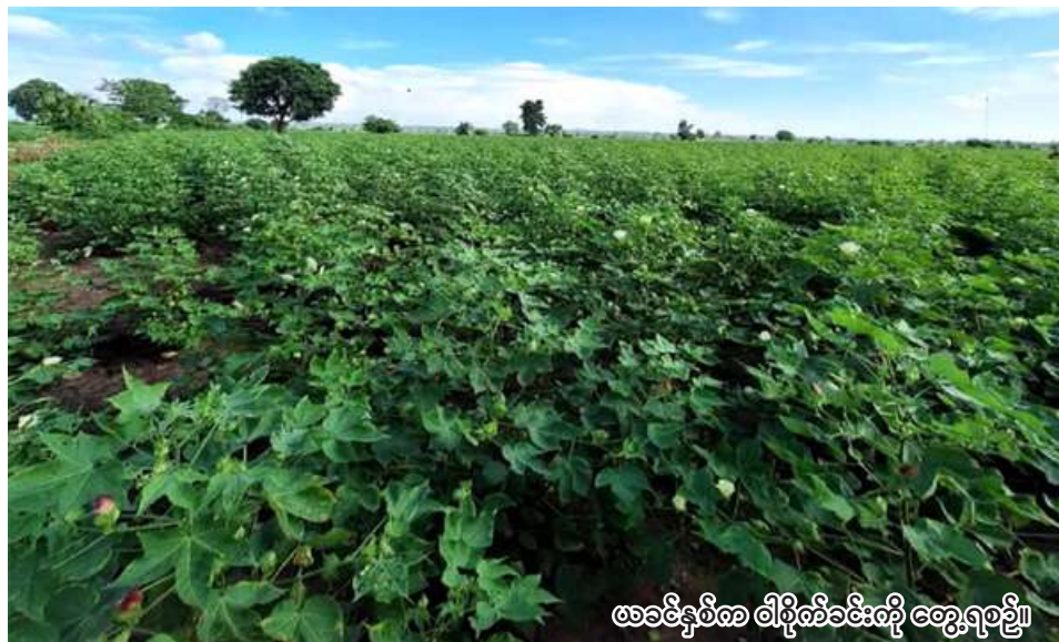
ဖခင်နှစ်က ဝါစိုက်ခင်းကို တွေ့ရစဉ်။

စစ်ကိုင်း မေ ၁၁ စစ်ကိုင်းမြို့နယ်တွင် မိုးသီးနှံ စိုက်ပျိုးရာသီ၌ ဝါ ၁၆၀၂၂ ဧက ၁၆၀၀၀ ကျော် စိုက်ပျိုးမည် ဖြစ်ကြောင်း စစ်ကိုင်းမြို့နယ် စိုက်ပျိုးရေးဦးစီးဌာနမှ သိရသည်။ စစ်ကိုင်း မေ ၁၁ စစ်ကိုင်းမြို့နယ်တွင် မိုးသီးနှံ စိုက်ပျိုးရာသီ၌ ဝါ ၁၆၀၂၂ ဧက ၁၆၀၀၀ ကျော် စိုက်ပျိုးမည် ဖြစ်ကြောင်း စစ်ကိုင်းမြို့နယ် စိုက်ပျိုးရေးဦးစီးဌာနမှ သိရသည်။