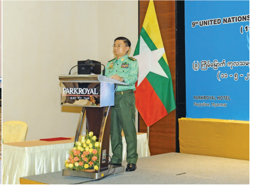
ဒုတိယတပ်မတော်ကာကွယ်ရေးဦးစီးချုပ် ကာကွယ်ရေးဦးစီးချုပ်(ကြည်း) ဗိုလ်ချုပ်ကြီးကျော်စွာလင်း ကုလသမဂ္ဂငြိမ်းချမ်းရေးထိန်းသိမ်းမှုလုပ်ငန်းစဉ်ဆိုင်ရာသင်တန်းဖွင့်ပွဲအခမ်းအနားတွင် မိန့်ခွန်းပြောကြားစဉ်။

နေပြည်တော် မေ ၁၁ မြန်မာ့တပ်မတော်မှ အရာရှိ၊ စစ်သည်များအနေ ဖြင့် ကုလသမဂ္ဂငြိမ်းချမ်းရေးထိန်းသိမ်းစောင့်ရှောက် မှုဆိုင်ရာလုပ်ငန်းတာဝန်များ သိရှိနိုင်စေရန်အတွက် မြန်မာ့တပ်မတော်နှင့် အိန္ဒိယတပ်မတော်တို့ပူးပေါင်း