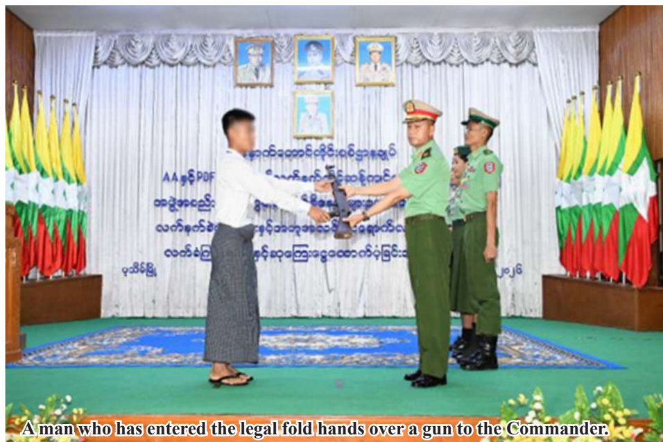
A man who has entered the legal fold hands over a gun to the Commander.