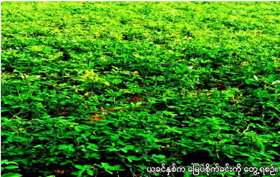
ယခုနှစ်က မြေပဲစိုက်ခင်းကို တွေ့ရစဉ်။

ရွှေဘို မေ ၁၁ စစ်ကိုင်းတိုင်းဒေသကြီး ရွှေဘိုခရိုင် ရွှေဘိုမြို့နယ်တွင် ယခုနှစ် မိုးသီးနှံစိုက်ပျိုးရာသီ၌ မြေပဲဧက ၁၀၃၇၀ စိုက်ပျိုးမည်ဖြစ်ကြောင်း ရွှေဘိုမြို့နယ်စိုက်ပျိုးရေးဦးစီးဌာနမှ သိရသည်။