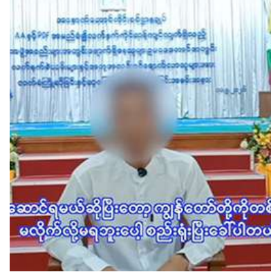
ဆောင်ရွက်မည်ဆိုပြီးတော့ ကျွန်တော်တို့ကစစ်မလိုက်လို့မရဘူးပေါ့ စည်းရုံးပြီးခေါ်ပါတယ်

နေထိုင်ရခြင်းနှင့် တပ်မတော်၏ တိုက်စစ်ကို ခုခံနိုင်တော့ခြင်းမရှိဘဲ စိတ်ဓာတ်ကျဆင်းလာခြင်းတို့အပြင် နိုင်ငံတော်နှင့် တပ်မတော်၏ ငြိမ်းချမ်းရေးလုပ်ငန်းစဉ်များကို ယုံကြည်လက်ခံပြီး ဥပဒေဘောင်အတွင်း ငြိမ်းချမ်းစွာ နေထိုင်၍ ၎င်းတို့ကြောင့် နစ်နာဆုံးရှုံးမှုများ ဖြစ်ပေါ်ခဲ့ရသည့် နိုင်ငံတော်နှင့် ပြည်သူလူထုအတွက် ပြန်လည်အကျိုးပြုလိုခြင်းတို့ကြောင့် လက်နက်ကိုင်လမ်းစဉ်ကိုစွန့်လွှတ်၍ ဥပဒေဘောင်အတွင်း ပြန်လည်ဝင်ရောက်ခဲ့ကြခြင်း ဖြစ်ကြောင်း သိရှိရသည်။ ထိုသို့ ဥပဒေဘောင်အတွင်း ပြန်လည်ဝင်ရောက်လာကြသူများကို ပြန်လည်ကြိုဆိုလက်ခံ၍ လိုအပ်သည့်ကူညီပံ့ပိုးမှုများဆောင်ရွက်ပေးပြီး မိဘအုပ်ထိန်းသူများထံသို့ စနစ်တကျပြန်လည်လွှဲအပ်ပေးလျက်ရှိရာ ဥပဒေဘောင်အတွင်းသို့ ပြန်လည်ဝင်ရောက်ရန် ဆန္ဒရှိသူများကျန်ရှိနေသေးကြောင်း သိရှိရ