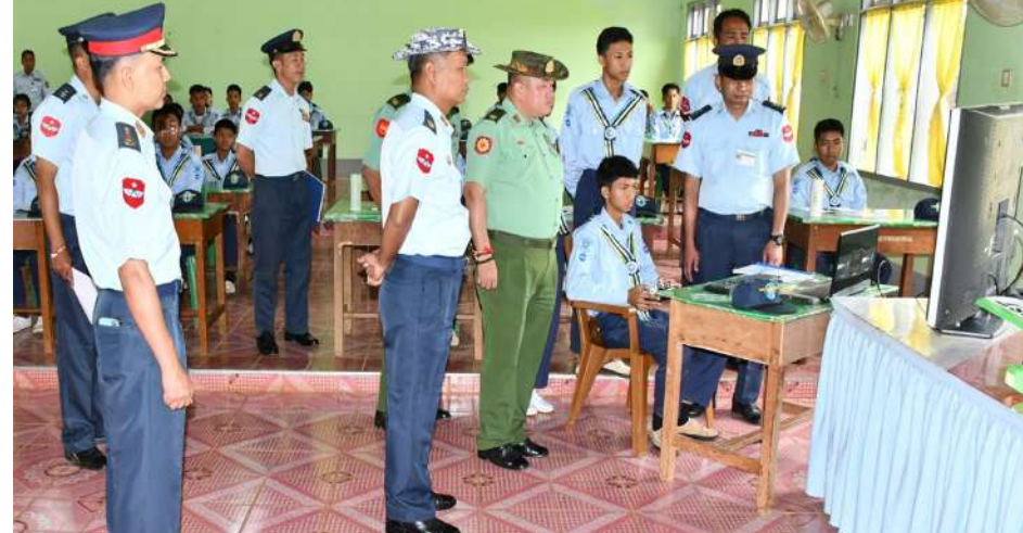
အရှေ့အလယ်ပိုင်း တိုင်းစစ်ဌာနချုပ်မှ တာဝန်ရှိသူများ သင်တန်းသား၊ သင်တန်းသူများ သင်ခန်းစာ သင်ကြားနေမှုကို ကြည့်ရှုအားပေးစဉ်။

ကို အမှာစကားပြောကြားပြီး သင်တန်းသား၊ သင်တန်းသူများအတွက် ဂုဏ်ပြုချီးမြှင့်ငွေ များနှင့် စားသောက်ဖွယ်ရာများ ချီးမြှင့် ပေးအပ်ကြရာ တာဝန်ရှိသူများနှင့် သင်တန်းသား၊ သင်တန်းသူများက လက်ခံရယူ ကြသည်။ ထို့နောက် တိုင်းစစ်ဌာနချုပ်မှ တာဝန်ရှိ သူများက သင်တန်းသား၊ သင်တန်းသူများ ကို ရင်းရင်းနှီးနှီးလိုက်လံနှုတ်ဆက်ကာ သင်ခန်းစာသင်ကြားနေမှုအား လိုက်လံ ကြည့်ရှုအားပေးခဲ့ကြောင်း သတင်း ရရှိသည်။ (၅၀၁)