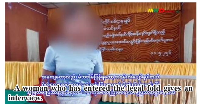
A woman who has entered the legal fold gives an interview.