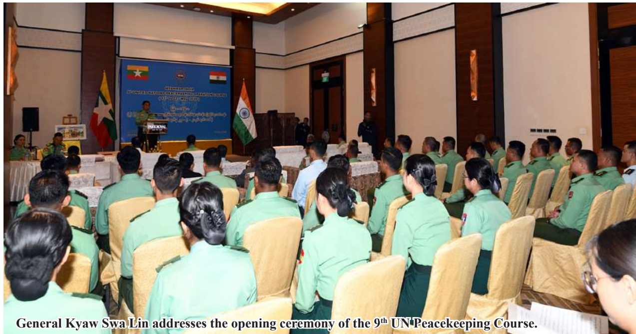
General Kyaw Swa Lin addresses the opening ceremony of the 9 th UN Peacekeeping Course.

Nay Pyi Taw May 11 The inauguration ceremony of a UN Peacekeeping Officer Course, jointly run by Myanmar Tatmadaw and Indian Armed Forces, took place at Parkroyal Hotel in Myanmar Tatmadaw.