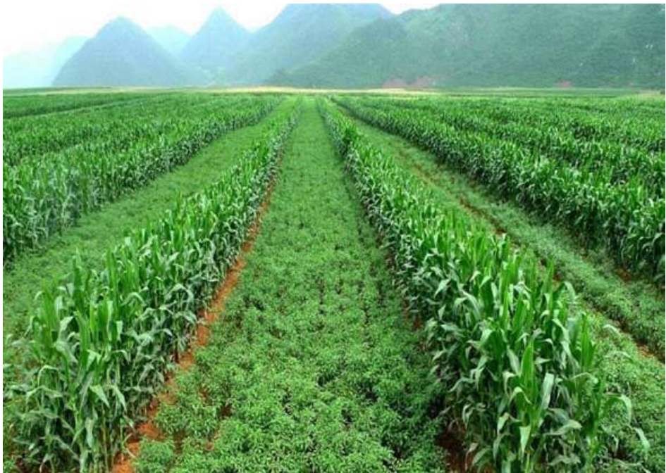
ပြောင်းနှင့် ကုလားပဲသီးညှပ်စိုက်ခင်းကိုတွေ့ရစဉ်။

ကိုးကား - ၂၀၂၅ ခုနှစ် မတ် ၂ ရက် ထုတ်သတင်းစာ