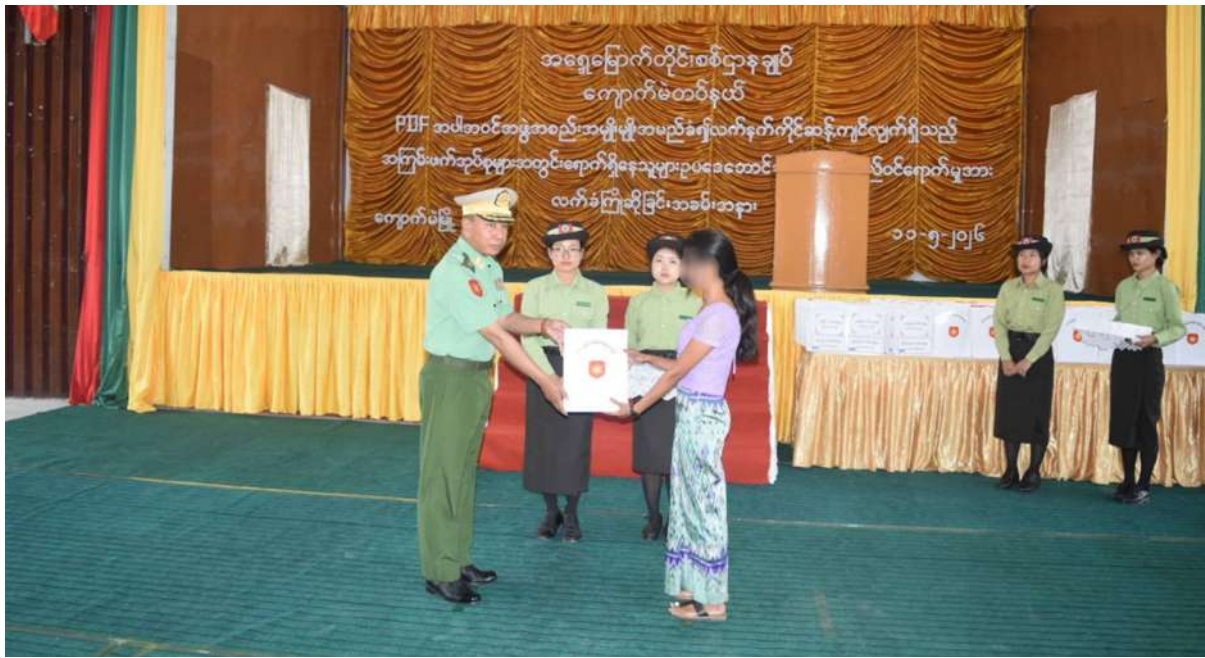
အရှေ့မြောက်တိုင်းစစ်ဌာနချုပ် တိုင်းမှူး ဗိုလ်ချုပ်အေးမင်းဦး ဥပဒေဘောင်အတွင်း ဝင်ရောက်လာသူတစ်ဦးကို ထောက်ပံ့ပစ္စည်း ပေးအပ်စဉ်။

နေပြည်တော် မေ ၁၁ နိုင်ငံတော်အစိုးရသည် PDF အပါအဝင် အဖွဲ့အစည်းအမျိုးမျိုးအမည်ခံ၍ လက်နက် ကိုင်ဆွဲကျင့်လျက်ရှိသည့် အဖွဲ့အစည်းများ အတွင်း ရောက်ရှိနေသူများကို ဥပဒေဘောင် အတွင်းသို့ ပြန်လည်ဝင်ရောက်ရန် ဖိတ်ခေါ် ၍ ဥပဒေဘောင်အတွင်းသို့ ပြန်လည်ဝင် ရောက်လာကြသူများကိုလည်း လိုအပ်သည့် ကူညီပံ့ပိုးမှုများ ဆောင်ရွက်ပေးလျက်ရှိရာ နိုင်ငံတော်နှင့် တပ်မတော်၏ငြိမ်းချမ်းရေး လုပ်ငန်းစဉ်များကို နားလည်သဘောပေါက် လာသည့် DPLA အဖွဲ့ဝင် အမျိုးသား ၁၆ ဦး၊ အမျိုးသမီးဦးရေ ၄၀၊ TNLA အဖွဲ့ဝင် အမျိုးသား သုံးဦးနှင့် PDF အဖွဲ့ဝင် အမျိုးသား ၁၁ ဦး၊ အမျိုးသမီး နှစ်ဦး စုစုပေါင်း ၇၂ ဦးတို့သည် ဥပဒေဘောင်အတွင်းသို့ ထပ်မံဝင်ရောက် လာကြသည်။ ထိုသို့ ဥပဒေဘောင်အတွင်းပြန်လည်ဝင် ရောက်လာကြသည့် ရှမ်းပြည်နယ်(မြောက် ပိုင်း) နောင်ချိုမြို့မှ အမျိုးသား ၁၇ ဦး၊ အမျိုးသမီး ၃၇ ဦး၊ ကျောက်မဲမြို့မှ အမျိုးသား ခြောက်ဦး၊ အမျိုးသမီး နှစ်ဦး၊ သီပေါမြို့မှ