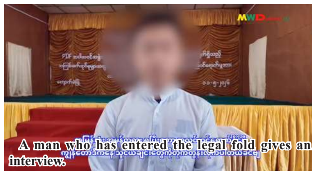
A man who has entered the legal fold gives an interview.