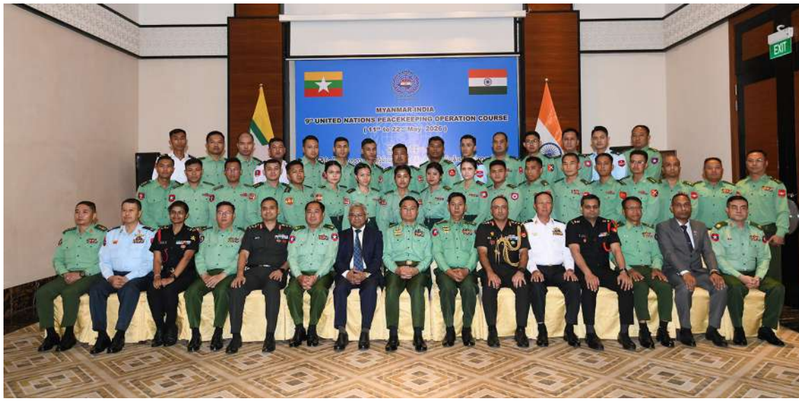
ဒုတိယတပ်မတော်ကာကွယ်ရေးဦးစီးချုပ် ကာကွယ်ရေးဦးစီးချုပ်(ကြည်း) ဗိုလ်ချုပ်ကြီးကျော်စွာလင်း၊ မြန်မာနိုင်ငံဆိုင်ရာ အိန္ဒိယနိုင်ငံသံအမတ်ကြီး H.E. Mr. Abhay Thakur၊ စစ်သံမှူးများ၊ အိန္ဒိယတပ်မတော်မှ နည်းပြအရာရှိများ၊ မြန်မာ့တပ်မတော်မှ သင်တန်းသားအရာရှိများနှင့်အတူ အမှတ်တရပေါင်းဓာတ်ပုံရိုက်စဉ်။

ကျောပုံးမှအဆက် ဦးစွာ ဒုတိယတပ်မတော်ကာကွယ်ရေးဦးစီးချုပ် ကာကွယ်ရေးဦးစီးချုပ်(ကြည်း) ဗိုလ်ချုပ်ကြီးကျော်စွာလင်းနှင့်အဖွဲ့ဝင်များသည် အိန္ဒိယတပ်မတော်အနေဖြင့် UN Peacekeeping ဆိုင်ရာ လုပ်ငန်းစဉ်များတွင် တာဝန်ထမ်းဆောင်ခဲ့မှုမှတ်တမ်းများနှင့် မြန်မာ-အိန္ဒိယတပ်မတော်နှစ်ရပ်အကြား ကုလသမဂ္ဂ ငြိမ်းချမ်းရေးထိန်းသိမ်းမှု လုပ်ငန်းစဉ်ဆိုင်ရာလေ့ကျင့်ခန်းများတွင် ပူးပေါင်းလေ့ကျင့်ခဲ့မှုမှတ်တမ်းများကို လေ့လာကြည့်ရှုကြရာ တာဝန်ရှိသူများက လိုက်လံရှင်းလင်းပြသကြသည်။