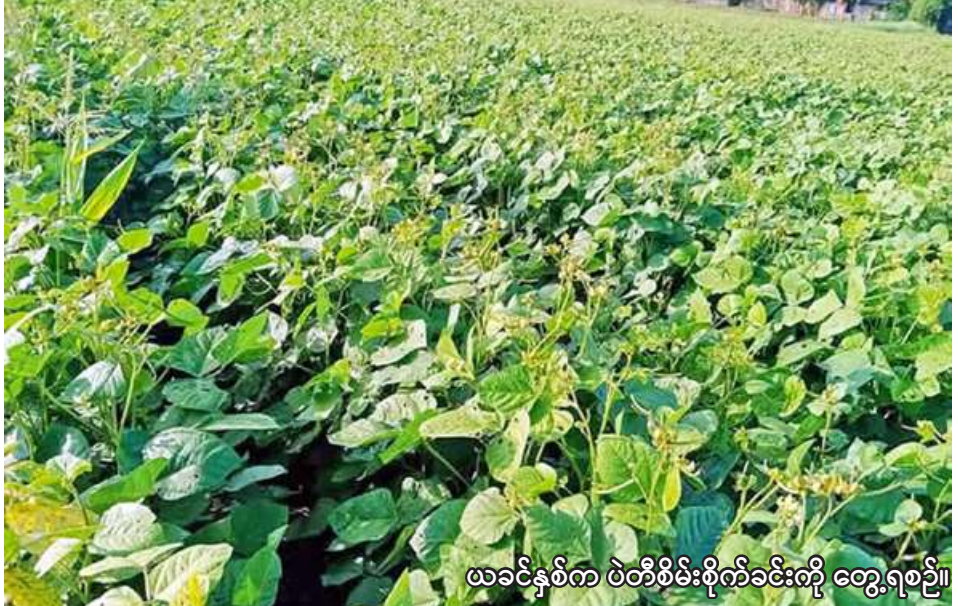
ယခင်နှစ်က ပဲတီစိမ်းစိုက်ခင်းကို တွေ့ရစဉ်။