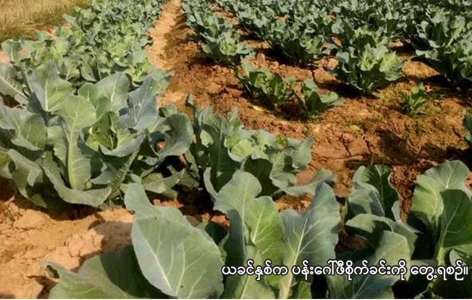
ယခင်နှစ်က ပန်းဂေါ်ဖီစိုက်ခင်းကို တွေ့ရစဉ်။

ကသာ မေ ၁၁ စစ်ကိုင်းတိုင်းဒေသကြီး ကသာ ခရိုင် ဗန်းမောက်မြို့နယ်တွင် ယခုနှစ် မိုးသီးနှံစိုက်ပျိုးရာသီ၌ ဟင်းသီးဟင်းရွက် ဧက ၂၆၉၀ စိုက်ပျိုးမည်ဖြစ်ကြောင်း ကသာ ခရိုင် စိုက်ပျိုးရေးဦးစီးဌာနမှ သိရသည်။ ယခုနှစ် မိုးသီးနှံ စိုက်ပျိုးရာသီ ၌ ဗန်းမောက်မြို့နယ်တွင် ဟင်းသီး ဟင်းရွက် ဧက ၂၆၉၀ စိုက်ပျိုးရန် လျာထားပြီး အဆိုပါ ဟင်းသီး ဟင်းရွက်စိုက်ပျိုးမှုကို မေလ စတင်ပတ်မှ စတင်စိုက်ပျိုးသွား မည်ဖြစ်ကြောင်း သိရသည်။ "ဒီနှစ် မိုးသီးနှံစိုက်ပျိုးရာသီ ဗန်းမောက်မြို့နယ်မှာ ဟင်းသီး ဟင်းရွက်ဧက ၂၆၉၀ စိုက်ပျိုးဖို့ လျာထားပါတယ်။ လျာထားဧက ပြည့်မီအောင် စိုက်ပျိုးနိုင်ဖို့ ဆောင် ရွက်ပေးသွားပါမယ်။ ဟင်းသီး ဟင်းရွက် စိုက်ပျိုးရာသီမှာ မုန့်ညင်း၊ ငရုတ်၊ နံနံ၊ အာလူး၊ ပန်းဂေါ်ဖီ စတဲ့သီးနှံတွေ စိုက်ပျိုး မှာဖြစ်ပါတယ်။ စိုက်ပျိုးတဲ့ ဟင်းသီးဟင်းရွက် အားလုံးကို