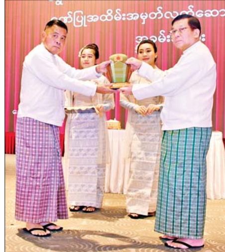
ရွေးကောက်တင်မြှောက်ခြင်းခံရသောသမ္မတ နိုင်ငံတော်လုံခြုံရေးနှင့် အေးချမ်းသာယာရေးကော်မရှင်ဥက္ကဋ္ဌ ဗိုလ်ချုပ်မှူးကြီး မင်းအောင်လှိုင်ကော်မရှင်အဖွဲ့ဝင် ရဲဝင်းဦးအား ဂုဏ်ပြုအထိမ်းအမှတ်လက်ဆောင် ပေးအပ်ချီးမြှင့်စဉ်။