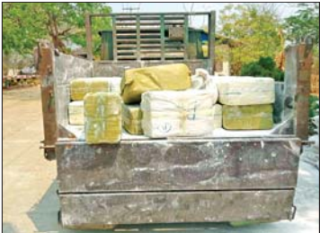
မူးယစ်ဆေးဝါးများတင်ဆောင်လာသည့် MDY/ 9V-54836 ထော်လာဂျီ စိမ်းပုတ်ရောင် (လှိုင်စင်ခဲ) ယာဉ်ကို တွေ့ရစဉ်။