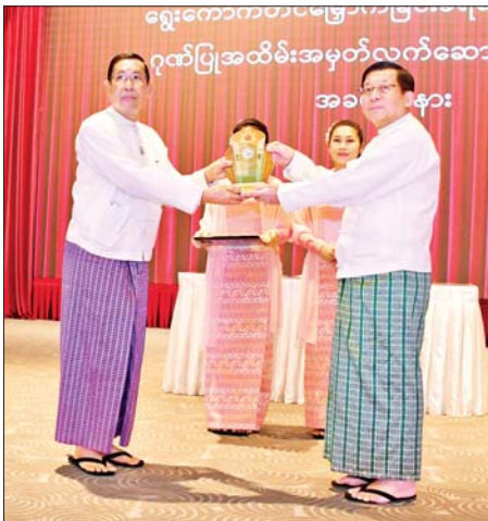
ရွှေ့ကောက်တင်မြောက်ခြင်းခံရသောသမ္မတ နိုင်ငံတော်လုံခြုံရေးနှင့် အေးချမ်းသာယာရေးကော်မရှင်ဥက္ကဋ္ဌ ဗိုလ်ချုပ်မှူးကြီးမင်းအောင်လှိုင် မြန်မာနိုင်ငံအမျိုးသားလူ့အခွင့်အရေးကော်မရှင်ဥက္ကဋ္ဌ ဦးပေါ်လွင်စိန်အား ဂုဏ်ပြုအထိမ်းအမှတ်လက်ဆောင် ပေးအပ်ချီးမြှင့်စဉ်။