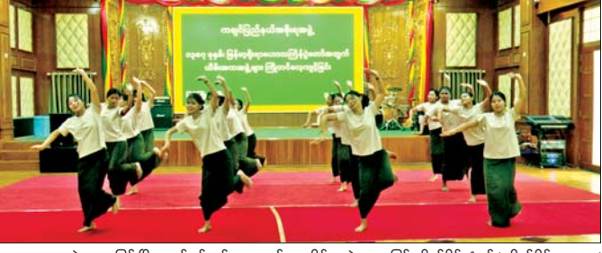
သာယာရေးအဖွဲ့အနေဖြင့် မြို့တော်ခန်းမ၌ လေ့ကျင့်ပြင်ဆင်လျက်ရှိသည်။ ယင်းသို့ ယိမ်းအဖွဲ့များ လေ့ကျင့်ပြင်ဆင်နေမှု များနှင့် စပ်လျဉ်း၍ ပြည်နယ်အစိုးရအဖွဲ့ ကိုယ်စားပြု ယိမ်းအဖွဲ့အနေဖြင့် ကိုယ်ပိုင်သံစဉ်/ ကိုယ်ပိုင်စာသား/ ဆိုင်းဝင်းနှင့် ယှဉ်ပြိုင်သွားမည်ဖြစ်ပြီး ပြည်နယ် အထွေထွေ အုပ်ချုပ်ရေးဦးစီးဌာနရုံး ယိမ်းအဖွဲ့ အနေဖြင့် စီဒီတေးသီချင်းဖြင့် ဝင်ရောက်ယှဉ်ပြိုင်

မြစ်ကြီးနား ဧပြီ ၅ မြန်မာ့ရိုးရာယဉ်ကျေးမှု မဟာသင်္ကြန်ပွဲတော်ကို ကျင်းပပြည့်နယ်၏ မြို့တော် မြစ်ကြီးနားမြို့၌ စည်ကားသိုက်မြိုက်စွာ ကျင်းပနိုင်ရေး စီစဉ်ဆောင်ရွက် လျက်ရှိသည့်အပြင် ဗဟိုမဏ္ဍပ်၌ ယိမ်းအကပြိုင်ပွဲများ ထည့်သွင်းကျင်းပနိုင်ရေး စီစဉ်ဆောင်ရွက်လျက်ရှိ ကြောင်း မဟာသင်္ကြန်ပွဲတော် ဖြစ်မြောက်ရေး ကော်မတီထံမှ သိရသည်။ သို့ဖြစ်ပါ၍ ဗဟိုမဏ္ဍပ်တွင် ယိမ်းအကပြိုင် ပါဝင် ယှဉ်ပြိုင်သွားမည့် ပြိုင်ပွဲဝင် ယိမ်းအဖွဲ့များအနေဖြင့် လေ့ကျင့်ပြင်ဆင်ဆောင်ရွက်လျက်ရှိရာ ကချင်ပြည်နယ်အစိုးရအဖွဲ့၊ ယိမ်းအဖွဲ့နှင့် အထွေထွေ အုပ်ချုပ်ရေးဦးစီးဌာန ယိမ်းအဖွဲ့တို့က ပြည်နယ် အစိုးရအဖွဲ့ရုံး၌ လေ့ကျင့်လျက်ရှိပြီး စည်ပင်