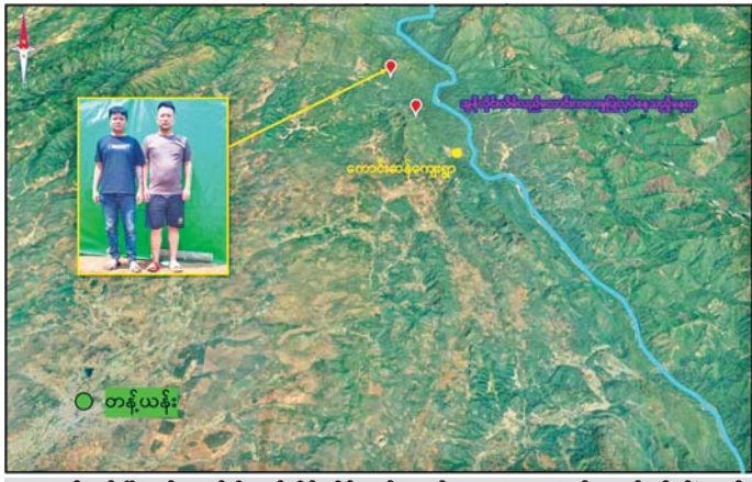
တန့်ယန်းမြို့နယ်အတွင်းရှိ အွန်လိုင်းလိမ်လည်လောင်းကစားမှု ကျူးလွန်ရာတွင် ပါဝင်ခဲ့သည့် တရုတ်နိုင်ငံသား နှစ်ဦးအား ထပ်မံဖမ်းဆီးရမိစဉ်။

လုပ်ဆောင်စဉ် အဆိုပါမြို့၏ အရှေ့မြောက်ဘက် မီတာ ၂၅၀၀ ခန့်အကွာ ကောင်းဆန်းကျေးရွာအနီး၌ အွန်လိုင်းလိမ်လည်လောင်းကစားမှု ကျူးလွန်သူများ၊ အွန်လိုင်းလိမ်လည်လောင်းကစားမှု ကျူးလွန်ရာတွင် အသုံးပြုသည့် လုပ်ငန်းသုံးပစ္စည်းများနှင့် နေထိုင်အသုံးပြုလျက်ရှိသည့် အဆောက်အအုံများကို ရှာဖွေဖော်ထုတ် ဖမ်းဆီးထိန်းသိမ်းနိုင်ခဲ့သည့် သတင်းအား ဧပြီ ၄ ရက်တွင် ထုတ်ပြန်ပြီးဖြစ်ပါသည်။ ယနေ့ ဧပြီ ၅ ရက်တွင်လည်း လုံခြုံရေးပူးပေါင်းအဖွဲ့များက အွန်လိုင်းလိမ်လည်လောင်းကစားမှု ကျူးလွန်သူများ ဝင်ရောက်အခြေပြုနေထိုင်ခြင်း မရှိစေရန်အတွက် ဆက်လက်ရှာဖွေဖော်ထုတ်ခဲ့ရာ မွန်လွဲ ၁၂ နာရီ ၅၅ မိနစ်ခန့်တွင် ကောင်းဆန်းကျေးရွာအနီး ယမန်နေ့က ဖမ်းဆီးရမိခဲ့သည့် နေရာ၏ မြောက်ဘက်မီတာ ၁၂၀၀ ခန့်အကွာ၌ အွန်လိုင်းလိမ်လည်လောင်းကစားမှု ကျူးလွန်ရာတွင် ပါဝင်ခဲ့သည့် တရုတ်နိုင်ငံသား အမျိုးသား နှစ်ဦးအား ထပ်မံတွေ့ရှိ ဖမ်းဆီးထိန်းသိမ်းနိုင်ခဲ့သည်။