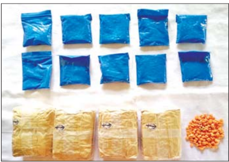
သိမ်းဆည်းရမိသည့် စိတ်ကြွေးသွပ်ဆေးပြားထုပ်ပိုးမှုစုံစုံကို တွေ့ရစဉ်။