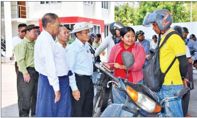
ပုသိမ်ခရိုင်စီမံခန့်ခွဲရေးနှင့် အုပ်ချုပ်ရေးကော်မတီ ဥက္ကဋ္ဌတို့က ပုသိမ်မြို့ပေါ်ရှိ Max Energy၊ Winner Petro ဆီဆိုင်များသို့ ကွင်းဆင်းကြည့်ရှု စစ်ဆေးခဲ့ပြီး စက်သုံးဆီ အရောင်းဆိုင်များတွင် Application အသုံးပြု၍ ရောင်းချရာတွင် စက်သုံးဆီအရောင်းဆိုင်နှင့် ဝယ်ယူသူခွဲသူများအကြား တွေ့ကြုံရသည့် အခက်အခဲများကို ဖြေရှင်းဆောင်ရွက်ပေးခဲ့ကြောင်း သိရသည်။ တိုင်းဒေသကြီး(ပြန်/ဆက်)

ပုသိမ် ဧပြီ ၅ ပြည်သူများ စက်သုံးဆီဝယ်ယူရာတွင် ပိုမိုအဆင်ပြေချောမွေ့စေရန် စက်စွမ်းအားအလိုက် ဝယ်ယူခွင့်ပမာဏကို သတ်မှတ်ပြီး ပိုမိုပြည့်စုံစေသည့်စနစ်ဖြင့် Bar Code/ QR Code အသုံးပြု၍ ယမန်နေ့နံနက်ပိုင်းမှစ၍ ပုသိမ်မြို့ပေါ်ရှိ စက်သုံးဆီအရောင်းဆိုင် ၄၃ ဆိုင်တွင် စက်သုံးဆီများ ရောင်းချပေးလျက်ရှိသည်။ ထိုကဲ့သို့ Bar Code/ QR Code စနစ်များဖြင့် ပုသိမ်မြို့ပေါ်ရှိ စက်သုံးဆီဆိုင်များတွင် ရောင်းချပေးနေမှုများကို ဧရာဝတီတိုင်းဒေသကြီး သယ်ဇာတရေးရာ ဝန်ကြီး၊ လမ်းပန်းဆက်သွယ်ရေး ဝန်ကြီး၊ ရေနံထွက်ပစ္စည်းကြီးကြပ်စစ်ဆေးရေးဦးစီးဌာန ညွှန်ကြားရေးမှူး၊ ပုသိမ်ခရိုင်စီမံခန့်ခွဲရေးနှင့် အုပ်ချုပ်ရေးကော်မတီ ဥက္ကဋ္ဌတို့က ပုသိမ်မြို့ပေါ်ရှိ Max Energy၊ Winner Petro ဆီဆိုင်များသို့