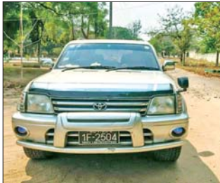
ဖမ်းဆီးရမိ ယာဉ်အမှတ် MDY-20/1F-2504 TOYOTA PRADO ခဲရောင်(လှိုင်စင်ခဲ)ယာဉ်ကို တွေ့ရစဉ်။