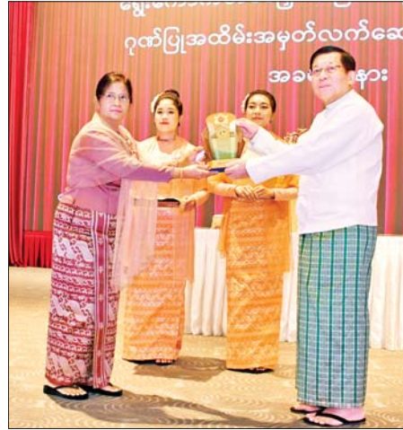
ရွှေ့ကောက်တင်မြောက်ခြင်းခံရသောသမ္မတ နိုင်ငံတော်လုံခြုံရေးနှင့် အေးချမ်းသာယာရေးကော်မရှင်ဥက္ကဋ္ဌ ဗိုလ်ချုပ်မှူးကြီးမင်းအောင်လှိုင် မြန်မာနိုင်ငံတော်ဗဟိုဘဏ်ဥက္ကဋ္ဌ ဒေါ်သန်းသန်းဆွေအား ဂုဏ်ပြုအထိမ်းအမှတ်လက်ဆောင် ပေးအပ်ချီးမြှင့်စဉ်။