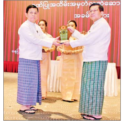
ရွေးကောက်တင်မြှောက်ခြင်းခံရသောသမ္မတ နိုင်ငံတော်လုံခြုံရေးနှင့် အေးချမ်းသာယာရေးကော်မရှင်ဥက္ကဋ္ဌ ဗိုလ်ချုပ်မှူးကြီး မင်းအောင်လှိုင် ပြည်ထောင်စုဝန်ကြီး ဦးမြင့်ကြိုင်အား ဂုဏ်ပြုအထိမ်းအမှတ်လက်ဆောင် ပေးအပ်ချီးမြှင့်စဉ်။