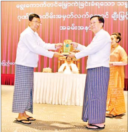
နိုင်ငံတော်လုံခြုံရေးနှင့် အေးချမ်းသာယာရေးကော်မရှင်အဖွဲ့ဝင် ဦးအောင်လင်းဒွေး ပြန်ကြားရေးဝန်ကြီးဌာန ဒုတိယဝန်ကြီး ဦးရဲတင့် အား ရွှေ့ကောက်တင်မြှောက်ခြင်းခံရသောသမ္မတ၏ ဂုဏ်ပြုအထိမ်း အမှတ်လက်ဆောင် ပေးအပ်ချီးမြှင့်စဉ်။

နိုင်ငံတော်လုံခြုံရေးနှင့် အေးချမ်း စိုလ်ချုပ်မျိုးကြီး မင်းအောင်လှိုင် သာယာရေးကော်မရှင် ဥက္ကဋ္ဌ က ကော်မရှင်ဒုတိယဥက္ကဋ္ဌ