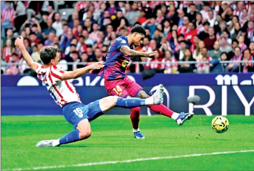
နဲ့ ဘာစီလိုနာအသင်းတို့ဟာ စပိန်ကိုပါ လည်း နှစ်ကြိမ်တွေဆုံခဲ့တာကြောင့် အတွင်း လေးကြိမ်မြောက် တွေ့ဆုံခြင်း ဖြစ်ပါတယ်။

အက်သလက်တီကိုမက်ဒရစ်အသင်း ဟာ ဘာစီလိုနာအသင်းကို ရှုံးနိမ့်ခဲ့တာ ကြောင့် စပိန်လာလီဂါပွဲစဉ်(၃၀) ယှဉ်ပြိုင် ကစားပြီးချိန်မှာ ရမှတ် ၅၇ မှတ်သာ စုဆောင်းနိုင်ခဲ့တာကြောင့် အမှတ်ပေး ဇယား အဆင့်(၄)နေရာမှာ ရပ်တည်နေ တာ ဖြစ်ပါတယ်။