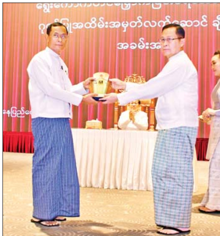
နိုင်ငံတော်လုံခြုံရေးနှင့် အေးချမ်းသာယာရေးကော်မရှင် ဒုတိယဥက္ကဋ္ဌ ဒုတိယဗိုလ်ချုပ်မှူးကြီးစိုးဝင်း ပြည်ထောင်စုတရားလွှတ်တော်ချုပ် တရားသူကြီး ဦးသိန်းကိုကိုအား ရွှေ့ကောက်တင်မြောက်ခြင်းခံရသောသမ္မတ၏ ဂုဏ်ပြုအထိမ်းအမှတ်လက်ဆောင် ပေးအပ်ချီးမြှင့်စဉ်။