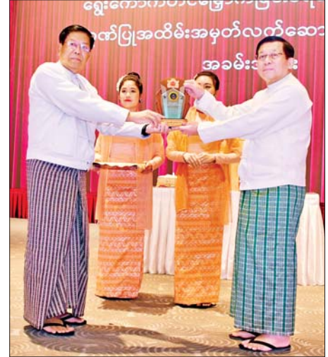
ရွေးကောက်တင်မြှောက်ခြင်းခံရသောသမ္မတ နိုင်ငံတော်လုံခြုံရေးနှင့် အေးချမ်းသာယာရေးကော်မရှင်ဥက္ကဋ္ဌ ဗိုလ်ချုပ်မှူးကြီး မင်းအောင်လှိုင် ကော်မရှင်အဖွဲ့ဝင် ပြည်ထောင်စုဝန်ကြီး ဦးသန်းဆွေအား ဂုဏ်ပြုအထိမ်းအမှတ်လက်ဆောင် ပေးအပ်ချီးမြှင့်စဉ်။