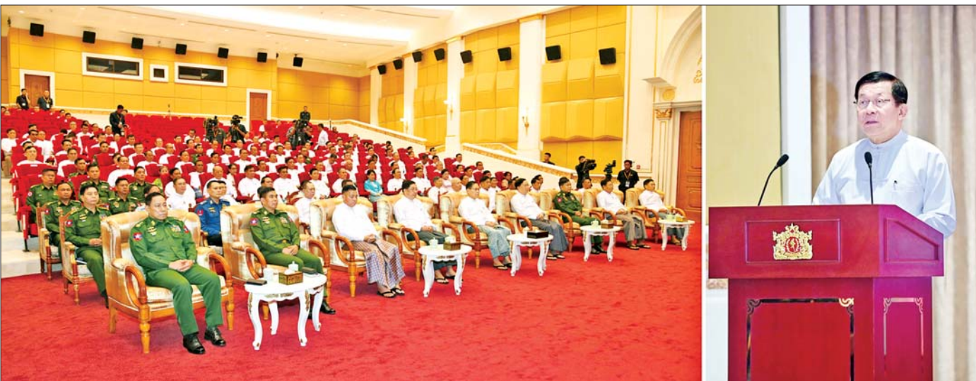
ရွေးကောက်တင်မြောက်ခြင်းခံရသောသမ္မတ နိုင်ငံတော်လုံခြုံရေးနှင့်အေးချမ်းသာယာရေးကော်မရှင်ဥက္ကဋ္ဌ ဗိုလ်ချုပ်မှူးကြီးမင်းအောင်လှိုင် ရွေးကောက်တင်မြောက်ခြင်းခံရသောသမ္မတ၏ ဂုဏ်ပြုအထိမ်းအမှတ် လက်ဆောင်ချီးမြှင့်ခြင်းအခမ်းအနားတွင် အမှာစကားပြောကြားစဉ်။