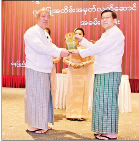
ရွေးကောက်တင်မြှောက်ခြင်းခံရသောသမ္မတ နိုင်ငံတော်လုံခြုံရေးနှင့် အေးချမ်းသာယာရေးကော်မရှင်ဥက္ကဋ္ဌ ဗိုလ်ချုပ်မှူးကြီး မင်းအောင်လှိုင် နိုင်ငံတော်ဖွဲ့စည်းပုံအခြေခံဥပဒေဆိုင်ရာ ခုံရုံးဥက္ကဋ္ဌ ဦးအောင်ဇော်သိန်းအား ဂုဏ်ပြုအထိမ်းအမှတ်လက်ဆောင် ပေးအပ်ချီးမြှင့်စဉ်။