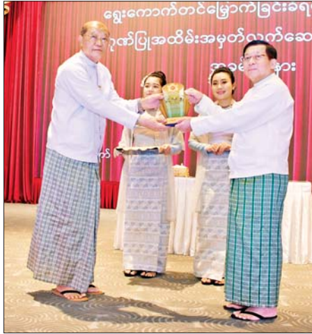
ရွှေ့ကောက်တင်မြောက်ခြင်းခံရသောသမ္မတ နိုင်ငံတော်လုံခြုံရေးနှင့် အေးချမ်းသာယာရေးကော်မရှင်ဥက္ကဋ္ဌ ဗိုလ်ချုပ်မှူးကြီးမင်းအောင်လှိုင် ပြည်ထောင်စုဝန်ကြီး Jeng Phang နော်တောင်အား ဂုဏ်ပြုအထိမ်းအမှတ်လက်ဆောင် ပေးအပ်ချီးမြှင့်စဉ်။