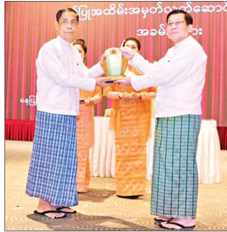
ရွေးကောက်တင်မြှောက်ခြင်းခံရသောသမ္မတ နိုင်ငံတော်လုံခြုံရေးနှင့် အေးချမ်းသာယာရေးကော်မရှင်ဥက္ကဋ္ဌ ဗိုလ်ချုပ်မှူးကြီး မင်းအောင်လှိုင် ပြည်ထောင်စုဝန်ကြီး ဦးကိုကိုလှိုင်အား ဂုဏ်ပြုအထိမ်းအမှတ် လက်ဆောင်ပေးအပ်ချီးမြှင့်စဉ်။