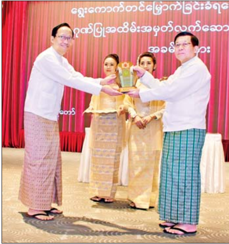
ရွှေ့ကောက်တင်မြောက်ခြင်းခံရသောသမ္မတ နိုင်ငံတော်လုံခြုံရေးနှင့် အေးချမ်းသာယာရေးကော်မရှင်ဥက္ကဋ္ဌ ဗိုလ်ချုပ်မှူးကြီးမင်းအောင်လှိုင် ပြည်ထောင်စုဝန်ကြီး ဒေါက်တာဘက်ခိုင်ဝင်းအား ဂုဏ်ပြုအထိမ်းအမှတ်လက်ဆောင် ပေးအပ်ချီးမြှင့်စဉ်။