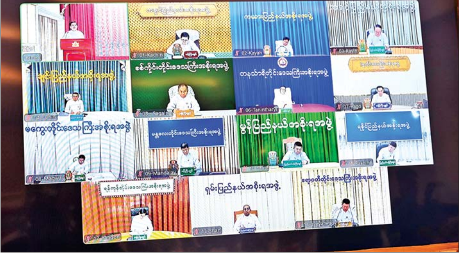
ရွှေ့ကောက်တင်မြှောက်ခြင်းခံရသောသမ္မတ၏ ဂုဏ်ပြုအထိမ်းအမှတ်လက်ဆောင် ချီးမြှင့်ခြင်းအခမ်းအနားသို့ တိုင်းဒေသကြီးနှင့် ပြည်နယ်ဝန်ကြီးချုပ်များက Video Conferencing ဖြင့် တက်ရောက်ကြစဉ်။