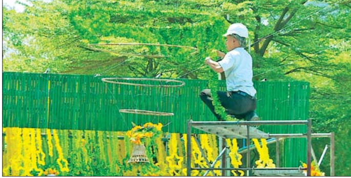
မင်္ဂလာမန္တလေးလမ်းလျှောက်သင်္ကြန်ဇုန်အတွင်း စွမ်းအင် ချွေတာသည့်အနေဖြင့် ဆိုလာပါဝါ စနစ်ဖြင့် ဆောင်ရွက်သွားမည်ဖြစ်ကြောင်းနှင့် သင်္ကြန်ချစ်သူပြည်သူ ခံစားရင်း သင်္ကြန်ပွဲတော်ကို မြန်မာ့ရိုးရာ ပျော်ရွှင်စွာ အတူတကွလာရောက် ဆင်နွှဲနိုင်ကြောင်း သိရသည်။ ရှေး အစီအစဉ်ကောင်းများကို မင်းထက်အောင်(မန်းကိုယ်ပွား)

မြန်မာ့ရိုးရာ အစဉ်အလာမပျက် ရေလောင်းနိုင်ဖို့ လောင်းလှေတွေ လည်း စီစဉ်ပေးသွားမှာပါ။ တခြား ထူးခြားတဲ့ အစီအစဉ်တွေလည်းရှိ ပါသေးတယ်” ဟု ငွေကပြောသည်။ ထို့ပြင် ယခုနှစ်တွင် ပြည်သူများ ပင်ပန်းခဲသမျှ မြေပျောက်၍ ပိုမို အပန်းဖြေစေလိုသည့် ရည်ရွယ်ချက်ဖြင့် မဏ္ဍပ်ကိုလည်း ခမ်းနား ထည်ဝါစွာ တည်ဆောက်နေပြီး နိုင်ငံကျော်အဆိုတော်ပေါင်းများစွာဖြင့် သင်္ကြန်ကာလအတွင်း ဖျော်ဖြေသွားမည် ဖြစ်ကာ စတင်သောကျေးဇူးလှူဒါန်းခြင်း များကိုလည်း သင်္ကြန်အကြိုနေ့မှ စတင်၍ နေ့စဉ်ဆောင်ရွက်ပေးသွားမည်ဖြစ်ကြောင်း ငွေကပြောသည်။