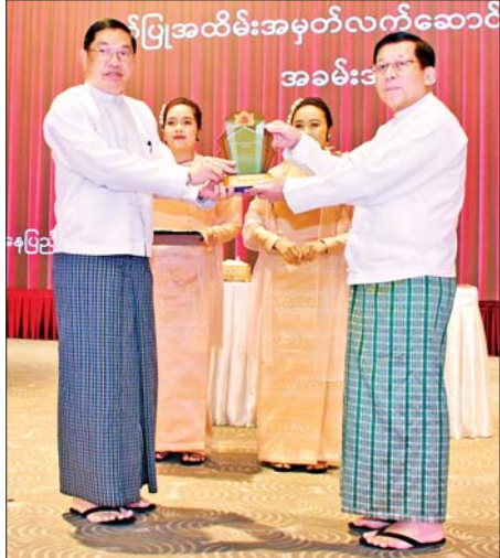
ရွေးကောက်တင်မြှောက်ခြင်းခံရသောသမ္မတ နိုင်ငံတော်လုံခြုံရေးနှင့် အေးချမ်းသာယာရေးကော်မရှင်ဥက္ကဋ္ဌ ဗိုလ်ချုပ်မှူးကြီး မင်းအောင်လှိုင်ကော်မရှင်အဖွဲ့ဝင် နိုင်ငံတော်ဝန်ကြီးချုပ် ဦးညိုစောအား ဂုဏ်ပြုအထိမ်းအမှတ် လက်ဆောင်ပေးအပ်ချီးမြှင့်စဉ်။