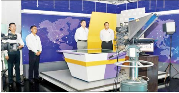
ပြည်ထောင်စုဝန်ကြီး ဦးထိန်လင်း မြန်မာ့အသံနှင့် ရုပ်မြင်သံကြားတွင် ကြည့်ရှုစစ်ဆေး စဉ်။

ယင်းနောက် ပြည်ထောင်စုဝန်ကြီးနှင့် အဖွဲ့သည် ပြည်လမ်းရှိ မြန်မာ့အသံနှင့် ရုပ်မြင် သံကြားသို့ရောက်ရှိပြီး စတူဒီယို(၁)တွင် လူမှုစီးပွားအစီအစဉ်နှင့် ဘဝနှင့် အနုပညာ အစီအစဉ် ရိုက်ကူးနေမှု၊ စတူဒီယို (၂)တွင် Shining Star ကလေးအစီအစဉ် ရိုက်ကူးနေမှု၊ News Studio တွင် သတင်းရိုက်ကူးနေမှု၊ စတူဒီယို(D)တွင် ခေတ်ပေါ်တေးဂီတအဖွဲ့ လေ့ကျင့်နေမှု၊ ရေဒီယိုဆောင် Master Room တွင် မြန်မာ့အသံဆိုင်းရိုင်းကြီးနှင့် တွဲဖက်၍