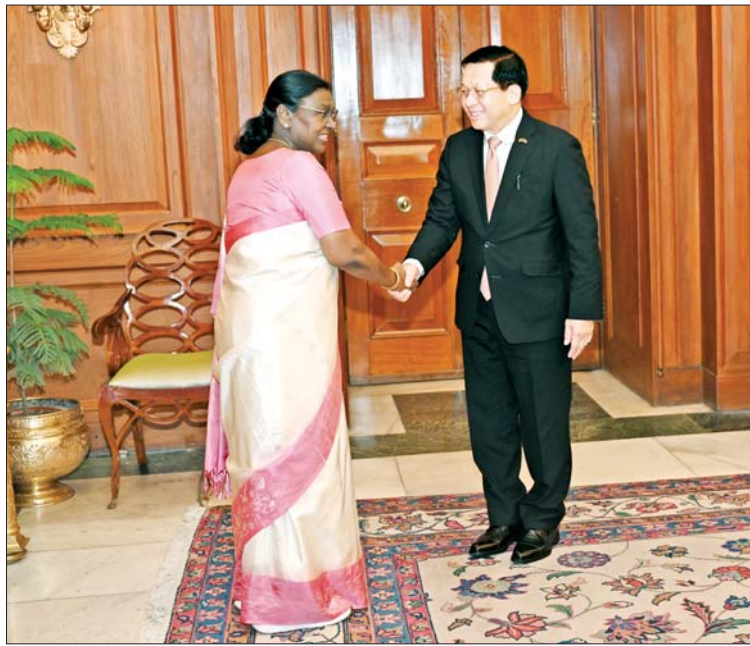
ပြည်ထောင်စုသမ္မတမြန်မာနိုင်ငံတော် နိုင်ငံတော်သမ္မတ ဦးမင်းအောင်လှိုင်အား အိန္ဒိယသမ္မတနိုင်ငံသမ္မတ H.E. Smt. Droupadi Murmu က ရင်းရင်းနှီးနှီးကြိုဆိုနှုတ်ဆက်စဉ်။

နေပြည်တော် ၇ ဇွန် ၁ အိန္ဒိယသမ္မတနိုင်ငံ၌ တရားဝင် ခရီးစဉ် ရောက်ရှိနေသော ပြည်ထောင်စုသမ္မတ မြန်မာနိုင်ငံတော် နိုင်ငံတော်သမ္မတ ဦးမင်းအောင်လှိုင်သည် ယနေ့ညနေ ပိုင်းတွင် အိန္ဒိယသမ္မတနိုင်ငံသမ္မတ H.E. Smt. Droupadi Murmu နှင့် ၎င်း၏ သမ္မတအိမ်တော် ဧည့်ခန်းမ၌ တွေ့ဆုံဆွေးနွေးသည်။