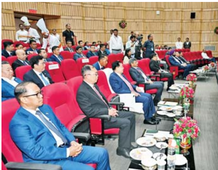
နိုင်ငံတော်သမ္မတ ဦးမင်းအောင်လှိုင်နှင့် မြန်မာအဆင့်မြင့်ကိုယ်စားလှယ်အဖွဲ့တို့ NETRA (NTPC Energy Technology Research Alliance)၏ လုပ်ငန်းဆောင်ရွက်မှု မှတ်တမ်းဗီဒီယိုကို မေ ၃၁ ရက်က ကြည့်ရှုကြစဉ်။

နိုင်ငံတော်သမ္မတကြီးဟာ တွေ့ဆုံဆွေးနွေးပွဲ အပြီးမှာ Greater Noida မြို့မှာရှိတဲ့ NETRA (NTPC Energy Technology Research Alliance) သို့ သွားရောက်လေ့လာကြည့်ပါ။ NTPC ကုမ္ပဏီရှိတဲ့ Greater Noida မြို့ကို ရောက်ရှိရုံအတွက် နိုင်ငံတော် သမ္မတကြီးနဲ့ဆောင်တဲ့ မြန်မာကိုယ်စားလှယ်အဖွဲ့ ဟာ နယူးဒေလီမြို့ကနေ မော်တော်ယာဉ်များနဲ့ တစ်နာရီခန့် သွားရောက်ခဲ့ကြရပြီး ကုမ္ပဏီသို့ ရောက်ရှိချိန်မှာတော့ ကုမ္ပဏီအကြီးအကဲက လှိုက်လှဲနေထွေးစွာဖြင့် ခရီးဦးကြီးဆိုခဲ့ကြပါတယ်။ အဲဒီနောက်မှာတော့ နိုင်ငံတော်သမ္မတနှင့်အဖွဲ့ဝင် တွေကို ကုမ္ပဏီက တာဝန်ရှိသူတွေက ကုမ္ပဏီရဲ့ လုပ်ငန်းဆောင်ရွက်နေမှုများနဲ့ အဆင့်မြင့်သိပ္ပံ