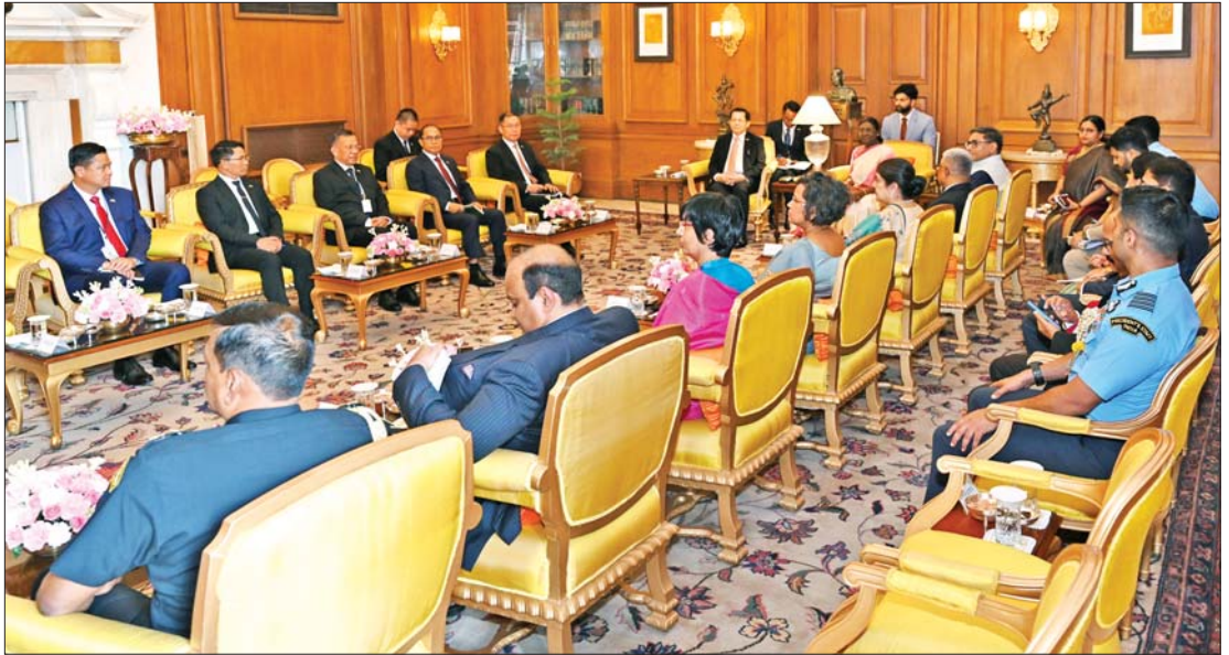
ပြည်ထောင်စုသမ္မတမြန်မာနိုင်ငံတော် နိုင်ငံတော်သမ္မတ ဦးမင်းအောင်လှိုင်နှင့် အိန္ဒိယသမ္မတနိုင်ငံသမ္မတ H.E. Smt. Droupadi Murmu တို့ တွေ့ဆုံဆွေးနွေးစဉ်။

ဇွန် ၂၀၂၆ အိန္ဒိယနိုင်ငံသံအမတ်ကြီး H.E. Shri Abhay Thakur နှင့် တာဝန်ရှိသူများ တက်ရောက်ကြသည်။