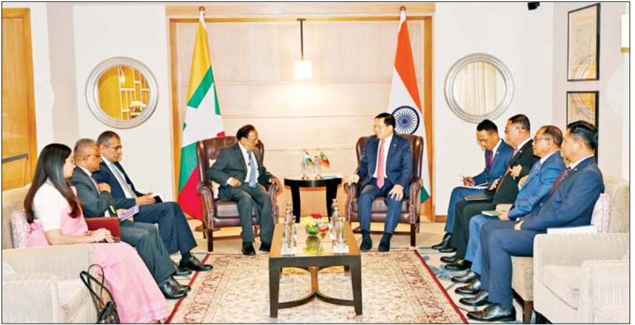
ပြည်ထောင်စုသမ္မတမြန်မာနိုင်ငံတော် နိုင်ငံတော်သမ္မတ ဦးမင်းအောင်လှိုင်နှင့် အိန္ဒိယနိုင်ငံ အမျိုးသားလုံခြုံရေးဆိုင်ရာ အကြံပေး ပုဂ္ဂိုလ် H.E. Mr. Ajit Doval တို့ တွေ့ဆုံဆွေးနွေးစဉ်။

ပေါင်းစုံ၌ ပူးပေါင်းဆောင်ရွက်မှု များ ဆက်လက်မြှင့်တင် ဆောင်ရွက်သွားမည့်ကိစ္စရပ်များ နှင့် ပတ်သက်၍ ရင်းနှီးပွင့်လင်းစွာ အမြင်ချင်းဖလှယ် ဆွေးနွေးခဲ့ကြ သည်။ အဆိုပါ တွေ့ဆုံပွဲတွင် နိုင်ငံတော် သမ္မတနှင့်အတူ ခရီးစဉ် လိုက်ပါသွားသည့် ပြည်ထောင်စု ဝန်ကြီးများ ဖြစ်ကြသည့် ဦးခင်မောင်ရီ၊ ဦးတင်မောင်ဆွေနှင့် တာဝန်ရှိ သူများ တက်ရောက်ကြပြီး အိန္ဒိယနိုင်ငံ အမျိုးသားလုံခြုံရေး ဆိုင်ရာ အကြံပေးပုဂ္ဂိုလ်နှင့်အတူ မြန်မာနိုင်ငံဆိုင်ရာ အိန္ဒိယနိုင်ငံ သံအမတ်ကြီး H.E. Shri Abhay Thakur နှင့် တာဝန်ရှိသူများ တက်ရောက်ခဲ့ကြကြောင်း သိရ သတင်းစဉ်