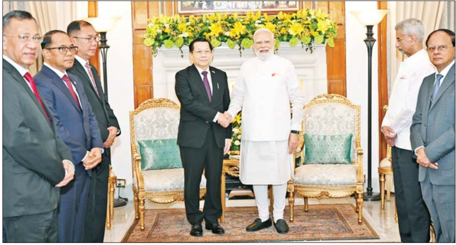
ပြည်ထောင်စုသမ္မတမြန်မာနိုင်ငံတော် နိုင်ငံတော်သမ္မတ ဦးမင်းအောင်လှိုင်နှင့် အိန္ဒိယသမ္မတနိုင်ငံဝန်ကြီးချုပ် H.E. Shri Narendra Modi တို့ ရင်းရင်းနှီးနှီးနှုတ်ဆက်စဉ်။