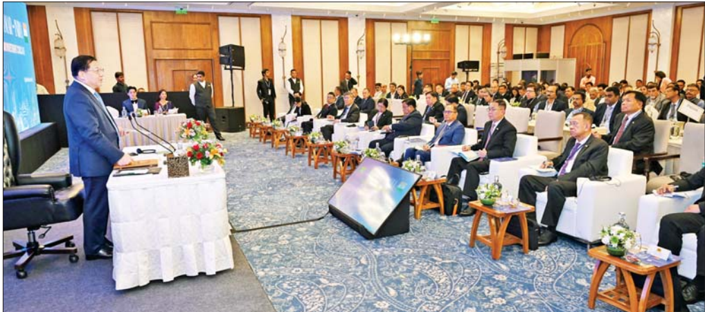
နိုင်ငံတော်သမ္မတ ဦးမင်းအောင်လှိုင် မေ ၃၁ ရက်က ကျင်းပသည့် မြန်မာ-အိန္ဒိယ ကုန်သွယ်မှုနှင့် ရင်းနှီးမြုပ်နှံမှုဆိုင်ရာ ဆွေးနွေးပွဲအခမ်းအနားတွင် ဆွေးနွေးပြောကြားစဉ်။

မြန်မာ-အိန္ဒိယကုန်သွယ်မှုနှင့် ရင်းနှီးမြုပ်နှံမှု ဆိုင်ရာဆွေးနွေးပွဲကို ပြည်ထောင်စုသမ္မတမြန်မာ နိုင်ငံတော် ကုန်သည်များနှင့် စက်မှုလက်မှုလုပ်ငန်း ရှင်များအသင်းချုပ် (UMFCCI) နာယက အဖွဲ့ဝင် များ၊ မြန်မာ-အိန္ဒိယ ချစ်ကြည်ရေးအသင်းဥက္ကဋ္ဌနဲ့ အဖွဲ့ဝင်များ၊ အိန္ဒိယနိုင်ငံ ကုန်သည်များနှင့် စက်မှု အသင်းချုပ်(FICCI) အတွင်းရေးမှူးချုပ်၊ အိန္ဒိယ စက်မှုလက်မှုလုပ်ငန်းရှင်များအဖွဲ့ချုပ် (CII)မှ Senior Advisor တို့ အပါအဝင် မြန်မာ-အိန္ဒိယ နှစ်နိုင်ငံ စီးပွားရေးလုပ်ငန်းရှင်များနဲ့ ဖိတ်ကြား ထားတဲ့ စည်ပညာတော်များ ရလဒ်စွာတက်ရောက် ခဲ့ပြီး နှစ်ဖက်အပြန်အလှန် ဆွေးနွေးမှုတွေကို