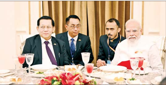
ပြည်ထောင်စုသမ္မတမြန်မာနိုင်ငံတော် နိုင်ငံတော်သမ္မတ ဦးမင်းအောင်လှိုင် အိန္ဒိယသမ္မတနိုင်ငံဝန်ကြီးချုပ် H.E. Shri Narendra Modi က တည်ခင်းဧည့်ခံသည့် ဂုဏ်ပြုနေ့လယ်စာစားပွဲတွင် အိန္ဒိယနိုင်ငံ ယဉ်ကျေးမှုအဖွဲ့က နှစ်နိုင်ငံရိုးရာတေးသီချင်းများဖြင့် တီးမှုတ်ဖျော်ဖြေတင်ဆက်နေမှုကို ကြည့်ရှုအားပေးစဉ်။