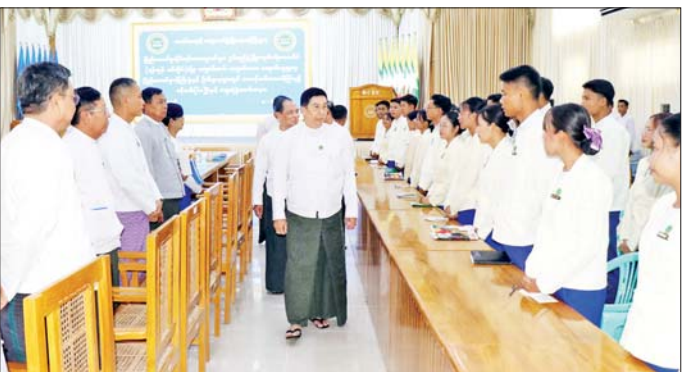
ကုန်ထုတ်လုပ်မှု မြှင့်တင်ရေး ဆောင်ရွက်ကြရန် လိုအပ် တင်ပြချက်များကို ပေါင်းစပ် ကြောင်း တိုက်တွန်းမှာကြားပြီး ဖြည့်ဆည်း ဆောင်ရွက်ပေးခဲ့ ကျောင်းဆင်း ဝန်ထမ်းများ၏ ကြောင်း သိရသည်။ သတင်းစဉ်

ရည်မှန်းချက်၊ ရည်ရွယ်ချက်နှင့် လုပ်ငန်းတာဝန်များ၊ သက်ဆိုင် ရာဦးစီးဌာနများ၏ လုပ်ငန်း တာဝန်များကို သိရှိလိုက်နာ ဆောင်ရွက်နိုင်ရေး လုပ်ငန်းခွင် ဝင်သင်တန်းကို ဖွင့်လှစ်ပို့ချပေးခဲ့ ပြီးဖြစ်ကြောင်း၊ လုပ်ငန်းတာဝန် များ ထမ်းဆောင်ရာတွင် စည်းစည်း လုံးလုံး ညီညွတ်ညွတ်ဖြင့် အလုပ်တာဝန်အပေါ် ဂုဏ်ယူစွာ တာဝန်ထမ်းဆောင်ကြရန် လိုအပ် ကြောင်း၊ အထူးသဖြင့်ကိုယ်ရောက် ရှိရာဒေသရှိကျေးလက်နေပြည်သူ များ၏ လူမှုစီးပွားဘဝမြှင့်မား ရေး၊ မိသားစုဝင်ငွေတိုးပွားရေး၊ ကျေးလက်ဒေသဖွံ့ဖြိုးရေးစိုက်ပျိုး ရေး၊ မွေးမြူရေးကို အခြေခံသည့်