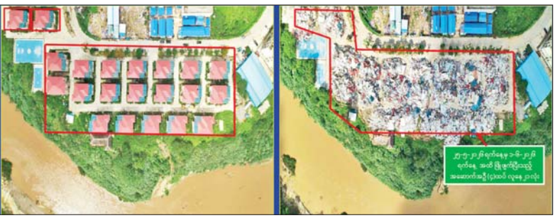
ကရင်ပြည်နယ် မြဝတီခရိုင် ရွှေကုက္ကိုလ်ဒေသ၌ တရားမဝင်အွန်လိုင်းလောင်းကစားလုပ်ငန်းများ လုပ်ကိုင်ခဲ့သည့် တရားမဝင်အဆောက်အအုံများအား မဖြိုဖျက်မီနှင့် ဖြိုဖျက်ပြီးနောက် တွေ့ရစဉ်။

နေပြည်တော် ဇွန် ၁ နိုင်ငံတော်အစိုးရအနေဖြင့် အွန်လိုင်းလိမ်လည်လောင်းကစားမှုများကို အခြေချလုပ်ကိုင်ခဲ့ကြသည့် ရွှေကုက္ကိုလ်နယ်မြေနှင့် KK Park နယ်မြေများရှိ တရားမဝင်အဆောက်အအုံများအတွင်း အွန်လိုင်းလိမ်လည်လောင်းကစားလုပ်ငန်းများ လုပ်ကိုင်ခြင်းမရှိစေရေး ဌာနဆိုင်ရာပူးပေါင်းအဖွဲ့များဖြင့် ဝင်ရောက်ရှင်းလင်း၍ လုပ်ငန်းလုပ်ဆောင်ရာတွင် အသုံးပြုခဲ့သည့် သိမ်းဆည်းရမိပစ္စည်းများအား စနစ်တကျဖျက်ဆီးခြင်းနှင့် တရားမဝင်အဆောက်အအုံများအားအသုံးပြု၍ အွန်လိုင်းလိမ်လည်လောင်းကစားမှုများ ထပ်မံကျူးလွန်ခြင်း