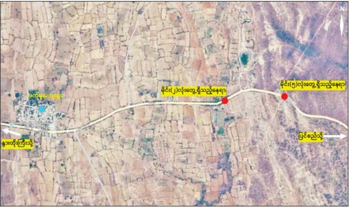
လုံခြုံရေးတပ်ဖွဲ့ဝင်များက နွားထိုးကြီးမြို့နယ် နွားထိုးကြီး-ပြင်စည်ကားလမ်းဘေး၌ PDF အမည်ခံ အကြမ်းဖက်သောင်းကျန်းသူများထောင်ထားသည့် လက်လုပ်မိုင်း ခုနှစ်လုံးအား ဖယ်ရှားရှင်းလင်းနိုင်ခဲ့သည့် နေရာပြပုံ။

နေပြည်တော် ဇွန် ၁ PDF အမည်ခံ အကြမ်းဖက်သောင်းကျန်းသူများသည် အများပြည်သူ သွားလာအသုံးပြုလှုပ်ရှားသည့် လမ်း၊ တံတားများတွင် ဒေသခံပြည်သူများနှင့် ခရီးသွားပြည်သူများ ထိခိုက်ဒဏ်ရာ ရရှိစေရန်၊ လမ်းပန်းဆက်သွယ်ရေး ထိခိုက်ပျက်ပြားစေပြီး ဒေသတွင်း ဖွံ့ဖြိုးတိုးတက်မှုကို နှောင့်ယှက်ဖျက်ဆီးရန်ရည်ရွယ်၍ ဖောက်ခွဲရေးပစ္စည်းကိရိယာများ အသုံးပြုကာ မိုင်းထောင်ခြင်း၊ ဖောက်ခွဲဖျက်ဆီးခြင်းများကို ဆင်ခြင်တုံတရားကင်းမဲ့စွာ ပြုလုပ်လျက်ရှိသည်။ စာမျက်နှာ ၁၅ ကော်လံ ၄ သို့ ❖