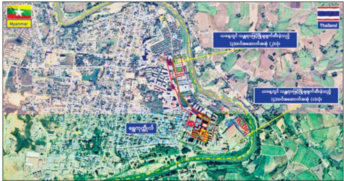
ကရင်ပြည်နယ် မြဝတီခရိုင် ရွှေကုက္ကိုလ်ဒေသရှိ အန္တလိုင်ဒ်လောင်းကစားလုပ်ငန်း လုပ်ကိုင်ခဲ့သည့် တရားမဝင် အဆောက်အအုံများအား ဖောက်ခွဲဖျက်ဆီးမှု။