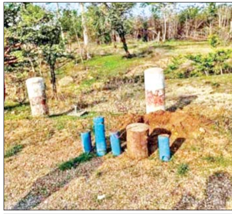
PDF အမည်ခံ အကြမ်းဖက်သောင်းကျန်းသူများ ထောင်ထားသည့် လက်လုပ်မိုင်းများအား တွေ့ရစဉ်။

ထိုသို့ လုပ်ဆောင်လျက်ရှိရာ မန္တလေးတိုင်းဒေသကြီး နှားထိုးကြီး မြို့နယ်ရှိ နှားထိုးကြီး-ပြင်စည် ကားလမ်းမကြီးတစ်လျှောက်တွင် PDF အမည်ခံ အကြမ်းဖက်သမား များက မိုင်းထောင်ခြင်းများ ဆောင်ရွက်နေကြောင်း တာဝန်သိ ပြည်သူများ၏ သတင်းပေးပို့ချက် အရ ယနေ့နံနက်ပိုင်းတွင် လုံခြုံရေး ပူးပေါင်းအဖွဲ့များက နှားထိုးကြီး မြို့နယ်အတွင်း နယ်မြေရှင်းလင်းခြင်းလုပ်ငန်းများ ဆောင်ရွက်ခဲ့ရာ ဖက်ဆူးကျော့နှင့် ရောက်တောင် ကျေးရွာအကြား ကားလမ်းဘေး ဝဲ/ယာ၌ မိုင်းရှင်းလင်းခြင်းများ ဆောင်ရွက်ခဲ့ရာ အများပြည်သူ ထိခိုက်ဒဏ်ရာရရှိစေရန် ရည်ရွယ်၍ PDF အမည်ခံ အကြမ်းဖက်အဖွဲ့ ထောင်ထားသည့် PVC ပိုက်ဖြင့် ပြုလုပ်ထားသော အချင်း ၆ လက်မခန့်၊ အလျား ၁ ပေခန့်ရှိ လက်လုပ်မိုင်း နှစ်လုံး၊ အချင်း ၆ လက်မခန့်၊ အလျား ၁ ပေခန့်ရှိ လက်လုပ်မိုင်း သုံးလုံး၊ အရှည် ၁ ပေခန့်ရှိ လက်လုပ်မိုင်း တစ်လုံး နှင့် သံပိုက်ဖြင့် ပြုလုပ်ထားသော